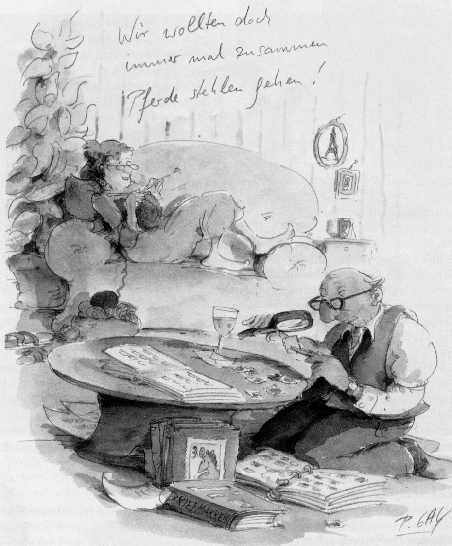
Bild aus: Ich will dich glücklich machen. © Peter Gaymann, Eichborn Verlag.

Die Erwartung, dass Menschen über sechzig gut mit Verlust und Trauer zurecht-