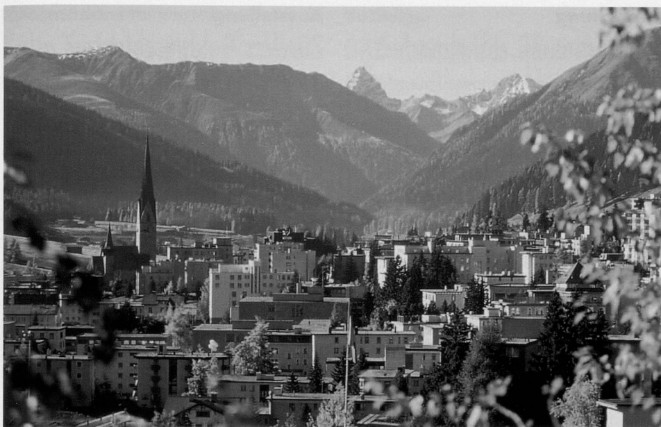
Davos: zum Wandern und Flanieren geeignet.