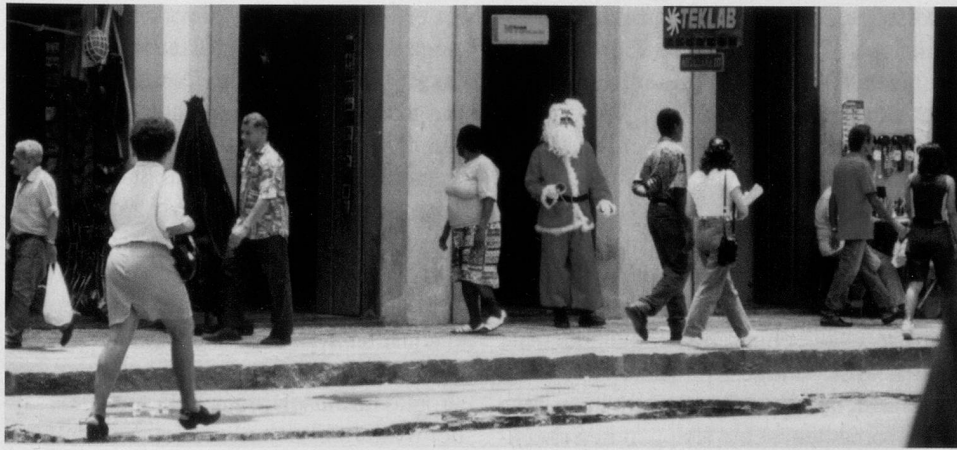
Wie sich der Weihnachtsmann wohl fühlt in seinem warmen Gewand?

Gefeiert werden die Sitten und Bräuche der Vorweihnachtszeit weltweit, selbst wenn sommerliche Temperaturen herrschen: Auch in Brasilien steht vor den Geschäften ein Nikolaus, selbstverständlich mit Bart und Kapuze, um weihnächtliche Stimmung zu verbreiten – allerdings in der sengenden Sonne. Oder ein australischer Ladenbesitzer imitiert fallenden Schnee in seinem weihnächtlich dekorierten Schaufenster, indem er mit dem Ventilator Styroporflocken durch die Luft wirbeln lässt. Es scheint, das traditionelle Brauchtum hat Bestand.