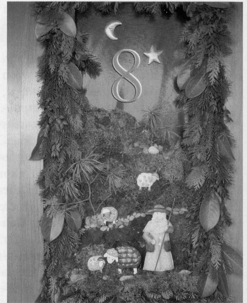
In vielen Orten gibt es festlich gestaltete Weihnachtsfenster zu bestaunen.

die Nase. Zum Beispiel beim Guetzlen. Und wenn Aufwand und Guetzli-Menge auszufern drohen, wieso nicht einmal eine Weihnachtsguetzli-Börse mit Freunden, Nachbarn oder Bekannten organisieren? Jede und jeder bäckt ein oder zwei Sorten und bei einem Kaffeetreff erhalten alle eine Portion jeder Sorte – und können gleich Backerfahrungen austauschen. Auch ein gemütlicher Adventsfenster-Spaziergang durchs Dorf lässt festliche Stimmung aufkommen. Die liebevoll und oft sehr aufwendig geschmückten Fenster und die gegenseitigen Besuche sind ein schöner Brauch während der Adventszeit.