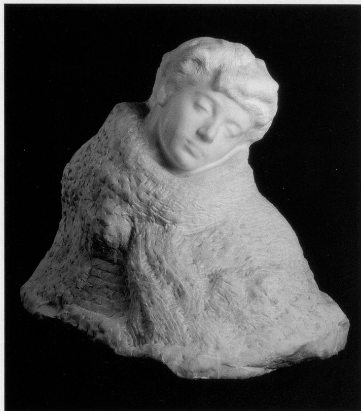
Auguste Rodin, Lady Sackville, 1914–16, Marmor, 57 x 75 x 57 cm Musée Rodin, Paris/Meudon

Bitte Talon senden an: Pro Senectute Kanton Zürich, Redaktion «visit», Forchstrasse 145, Postfach 1381, 8032 Zürich