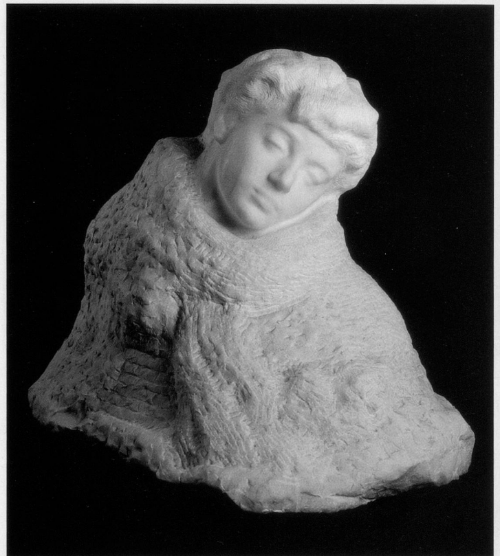
Auguste Rodin, Lady Sackville, 1914–16, Marmor, 57 x 75 x 57 cm Musée Rodin, Paris/Meudon

Bitte Talon senden an: Pro Senectute Kanton Zürich, Redaktion «visit», Forchstrasse 145, Postfach 1381, 8032 Zürich