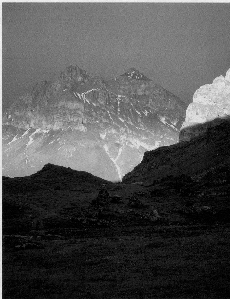
Isenthal Oberalp, Sommer 2005.

Die Ausstellung dauert noch bis zum 5. April 2007.