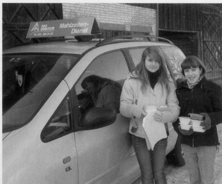
Bringen Mahlzeiten zu Senior/Innen nach Hause: Dank dem Projekt «x hoch Herz» begegnen einander Sechstklässler/innen und Senior/innen.

Es begleiteten auch ein paar Kinder die Fahrerinnen des Mahlzeitendienstes. Dort hatten sie direkten Kontakt zu älteren Leuten, die nicht mehr selber kochen. Die einen fanden es ein wenig anstrengend, da alles sehr schnell gehen muss. In einer Stunde besucht man etwa 12 Leute, da