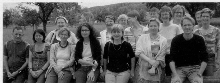
Haben den Lehrgang erfolgreich absolviert: Die Diplomgruppe des CAS Soziale Gerontologie 2006–2007.

Im Oktober 2006 startete zum ersten Mal der Zertifikatslehrgang (CAS) Soziale Gerontologie an der Hochschule für Soziale Arbeit Zürich. Der Kurs wurde in Kooperation mit Pro Senectute Kanton Zürich durchgeführt. Jetzt haben die ersten 18 Absolvent/innen erfolgreich abgeschlossen.