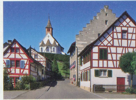
Wandern zur Klosterinsel Rheinau 30