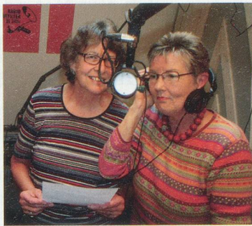
Radio «Seniorama» 24