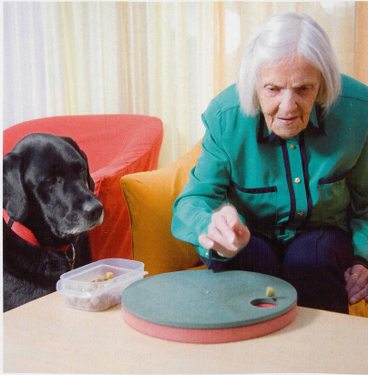
Einmal pro Woche kommt der Therapiehund Eos auf der Demenzabteilung zu Besuch.