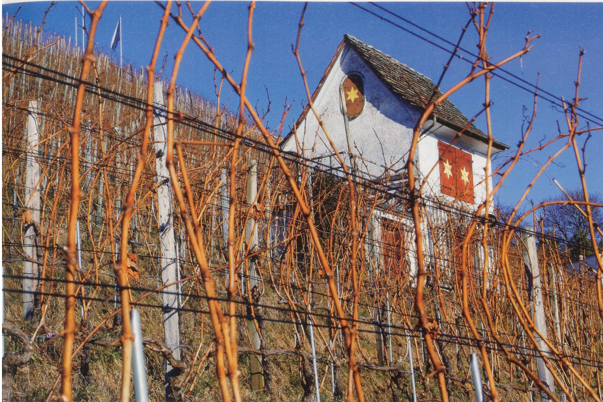
Der Charme der alten Rebhäuschen in der Sternenhalde.