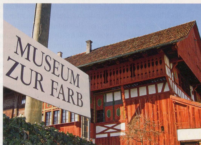
Wichtige Zeugen der industriellen Vergangenheit sind in Stäfa zu bewundern.