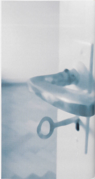
Türen öffnen für Menschen mit Demenz.

«Pfleger von Demenzkranken müssen sich täglich an neue Situationen und Anforderungen anpassen und schmerzliche Verluste hinnehmen.»