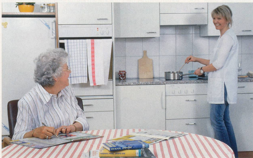
Ab dem 85. Altersjahr sind über 50 Prozent der Menschen im Alltag hilfsbedürftig.