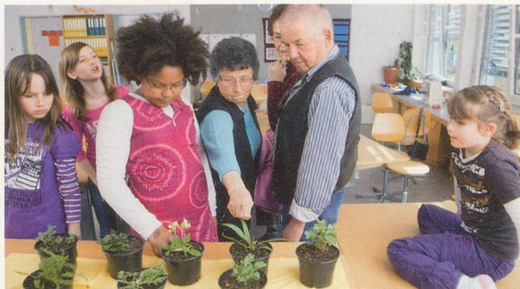
Kräuterkunde: Altes Wissen verzaubert junge Menschen 10