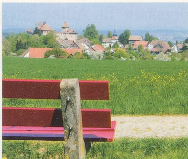
Wandern: Auf zur Kyburg 30