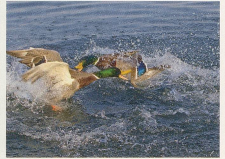
30 Entdecken: entlang der Limmat spazieren.