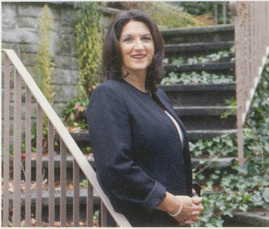
18 Innere Sicherheit: eigene Wünsche wahrnehmen.