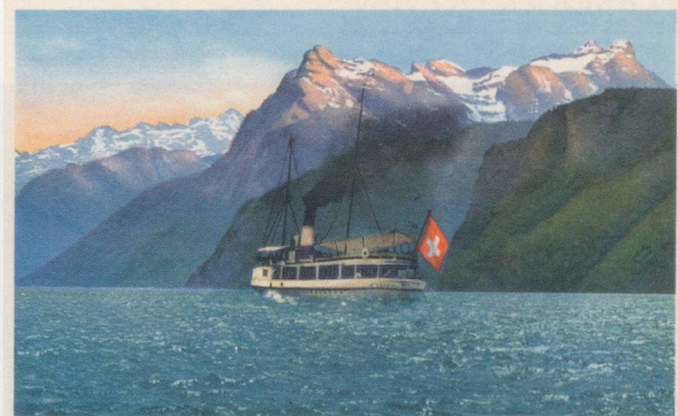
15202 Urnersee mit Urirotstock 2932 m