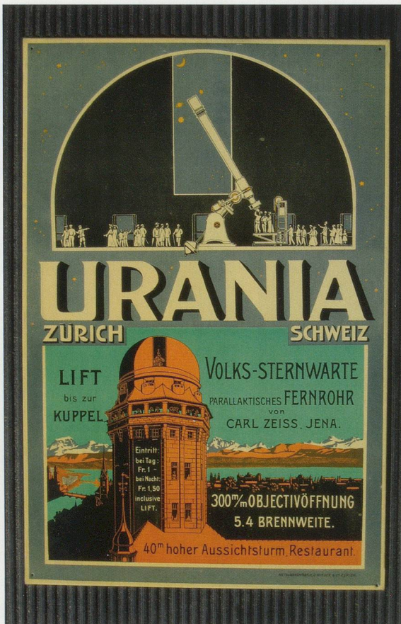
Das Fernrohr der Firma Carl Zeiss in der Sternwarte Urania wiegt zwölf Tonnen. Bild: Plakat aus den Anfangszeiten.