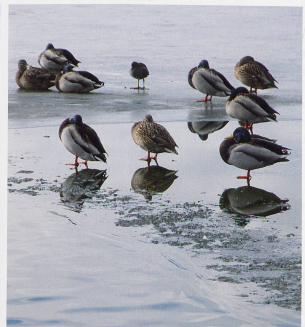
Das Naturschutzgebiet rund um den Pfäffikersee ist ein Wasser- und Zugvogelreservat von nationaler Bedeutung.