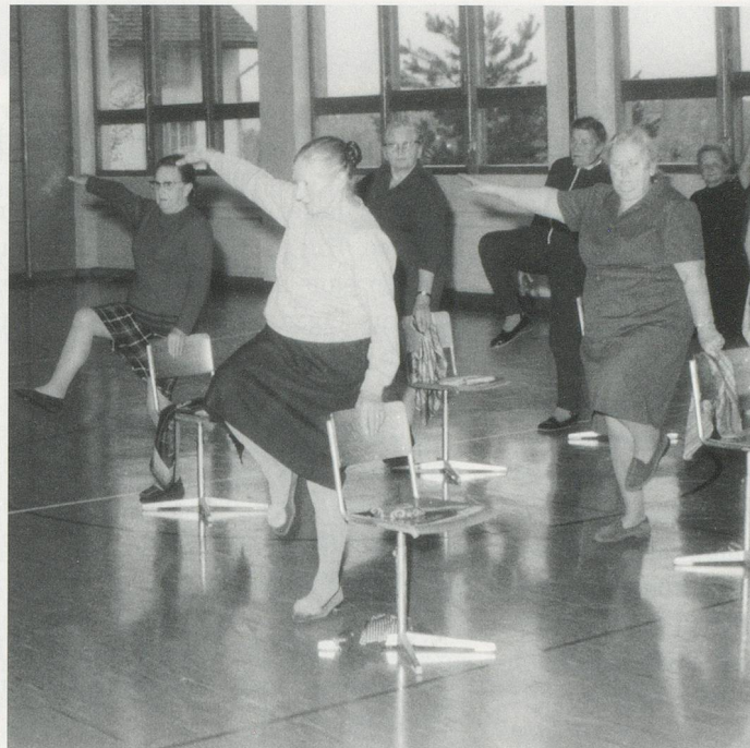
Links: Freudvolles Turnen auf dem Stuhl.