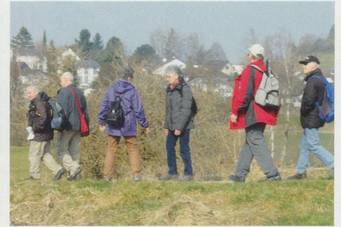
36 Das Weinland entdecken: Die Pro-Senectute-Wanderung entlang von Wäldern, Wiesen und Weihern.