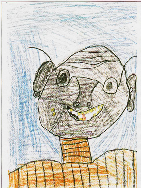
Loris (8 Jahre)