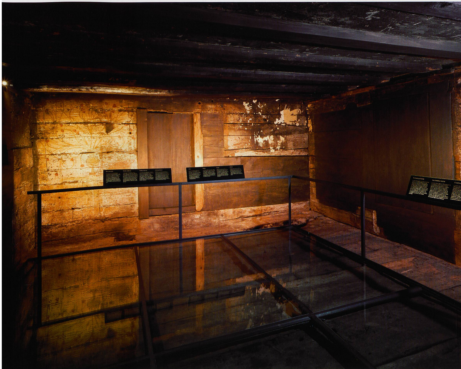
Wertvolles Zeugnis einstiger Wohnkultur: Stube aus dem Jahr 1311.