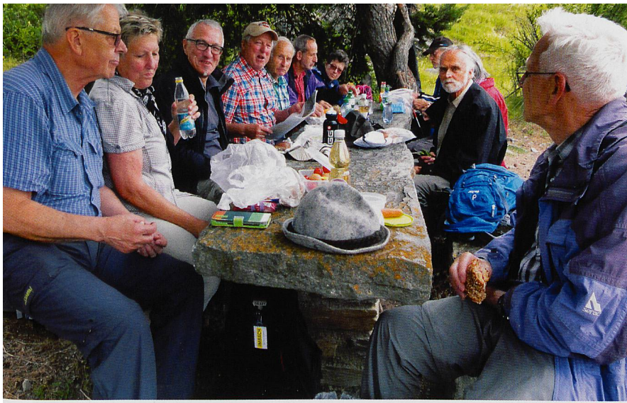
Auf dem «Riedgarten» (Bild oben) stärken wir uns, bevor der weitere Verlauf der Wanderung Abenteuerliches und Gewagtes für uns bereithält.