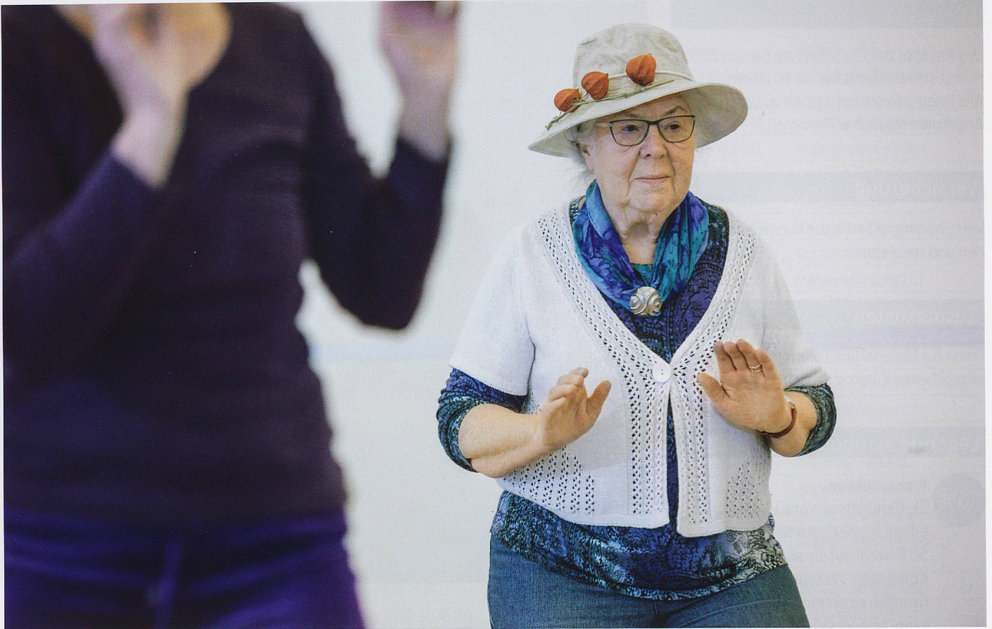
Wohin werden die Tanzenden im Geiste entführt?