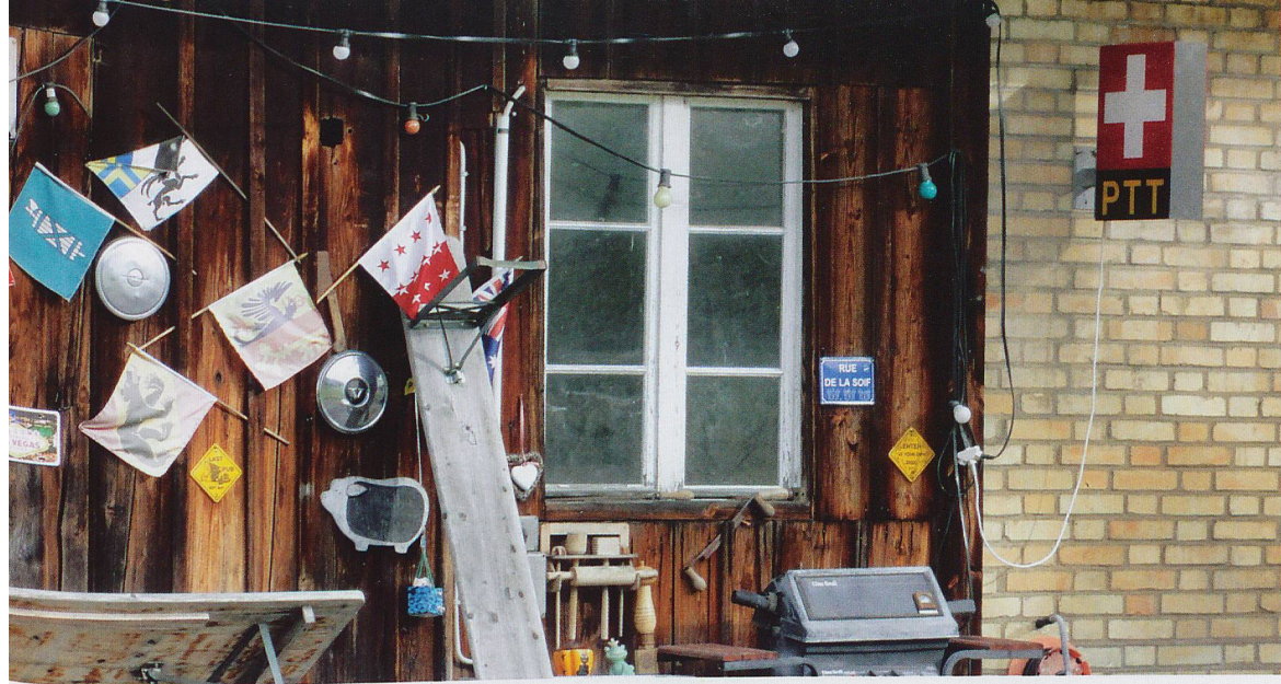
Die Wandergruppe Oetwil am See kommt an der Wirkungsstätte der Köhlerei Andelbach (Bild unten) vorbei und zuvor an einem Hof, der unter anderem mit einem alten PTT-Leuchtschild auffällt.