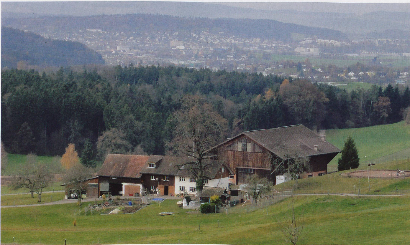
Auf der Anhöhe bietet sich ein prächtiger Blick Richtung Elsau und Winterthur.