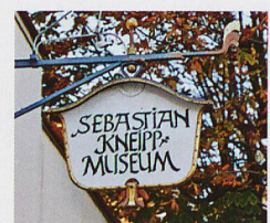
Oben: Sebastian Kneipps Lebenswerk im ortseigenen Museum Links: Kneipp-Armbad

Stöcklin Katalog Im Programm neben Bad Wörishofen auch Abano-Montegrotto, Montecatini und Ischia. Fordern Sie den Stöcklin Katalog 2017 unverbindlich an!