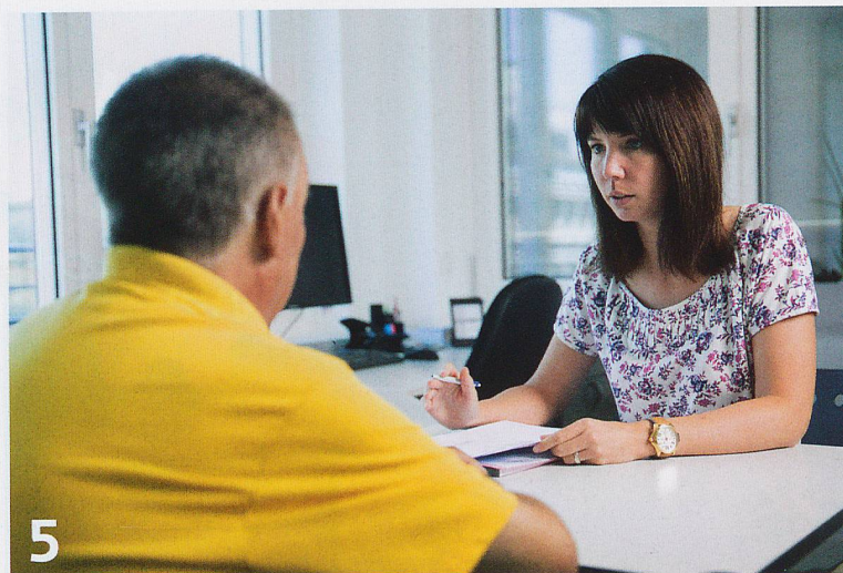
5 Seit 100 Jahren unterstützt Pro Senectute Kanton Zürich ältere Menschen und deren Angehörige mit vielfältigen Dienstleistungen.