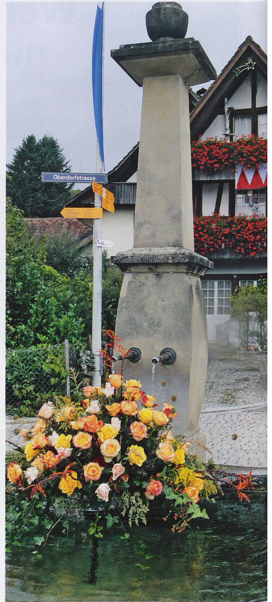
Rebberge bei Rafz, geschmückte Häuser und Brunnen in Wasterkingen, Würste über dem Feuer im Wald; und in einem Stall wird gerade ein Pferd beschlagen.