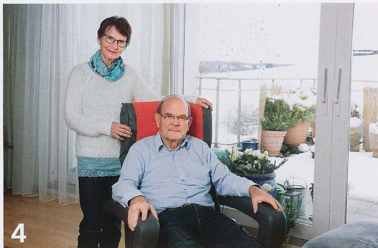
4 So lange wie möglich selbstständig zu Hause leben. Das wünschen sich viele Menschen. Angehörige und spitalexterne Dienste machen dies möglich.