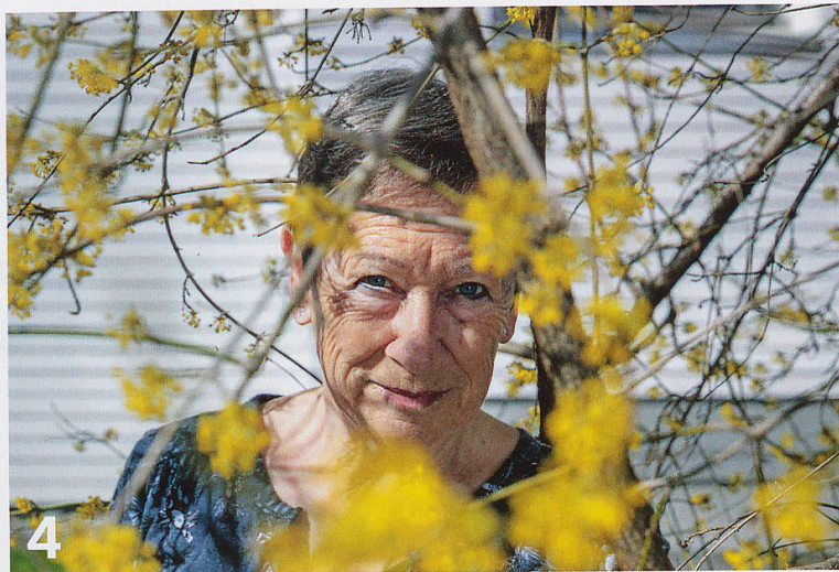
Medizin ohne Nebenwirkungen: Der Aufenthalt in der Natur macht glücklich und erhält gesund - vor allem auch im Alter.