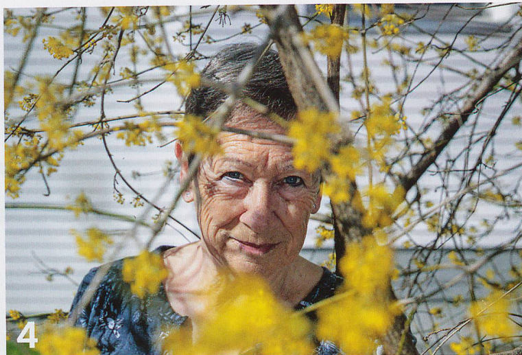
Medizin ohne Nebenwirkungen: Der Aufenthalt in der Natur macht glücklich und erhält gesund - vor allem auch im Alter.