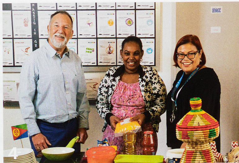
Loslassen, zulassen, sich einlassen: Neue Ziele im Alter halten geistig flexibel und gesund. Doch man muss sich auch auf Neues einlassen können.