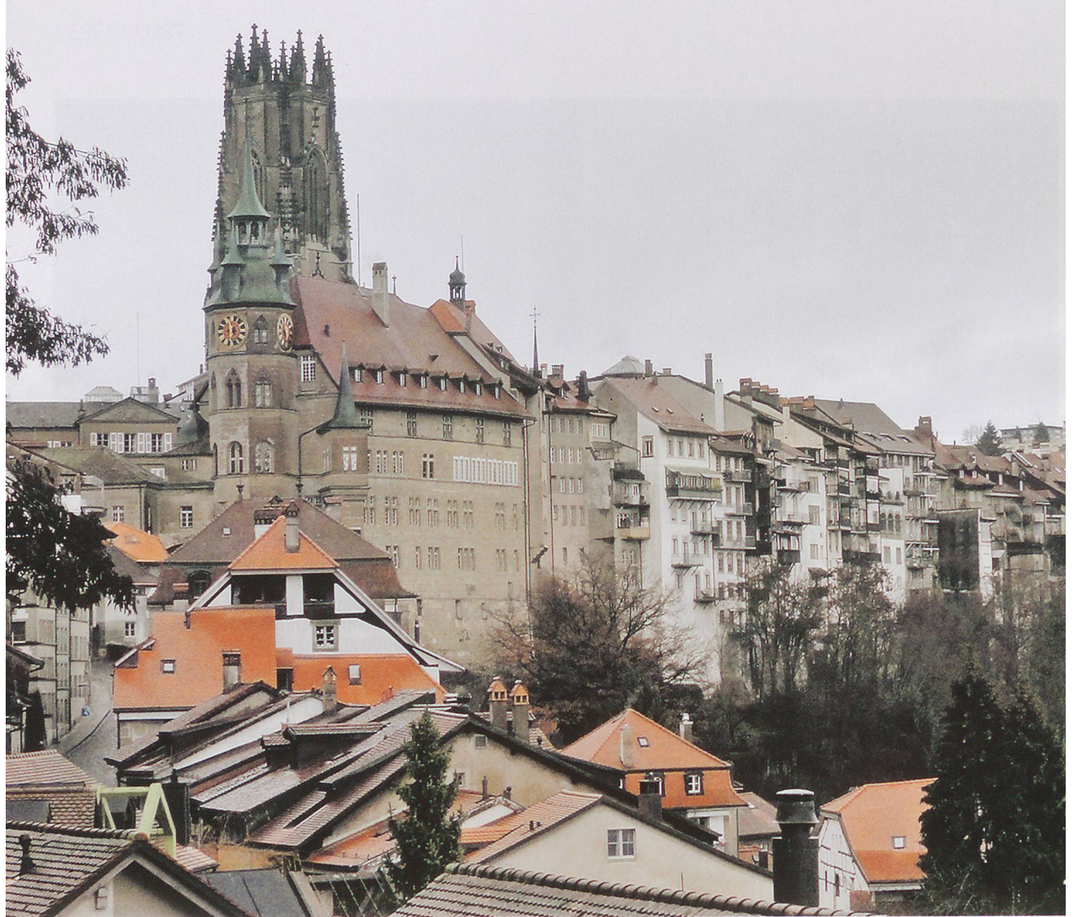
Blick von der Unterstadt Richtung Burgquartier mit der Kathedrale St. Nikolaus.