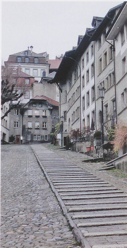
In Fribourg gehts immer irgendwie rauf oder runter – oft auf Kopfsteinstrassen.

Hier oben, im jüngeren Teil von Fribourg, hier macht das düster-be-klemmende Mittelalterliche der bunten Urbanität Platz. Hier, so scheint es, ist auch die für uns bekannte Hektik und Betriebsamkeit wieder zurück. Und es wird unverkennbar, dass Fribourg auch eine Universitätsstadt ist mit über 10 000 Studierenden aus über 100 Nationen. Neben der zweisprachigen Universität gibt es hier mehrere Hochschulen der Fachbereiche Architektur, Ingenieurwesen, Management, Gesundheit, Sozialwesen und Pädagogik. ■