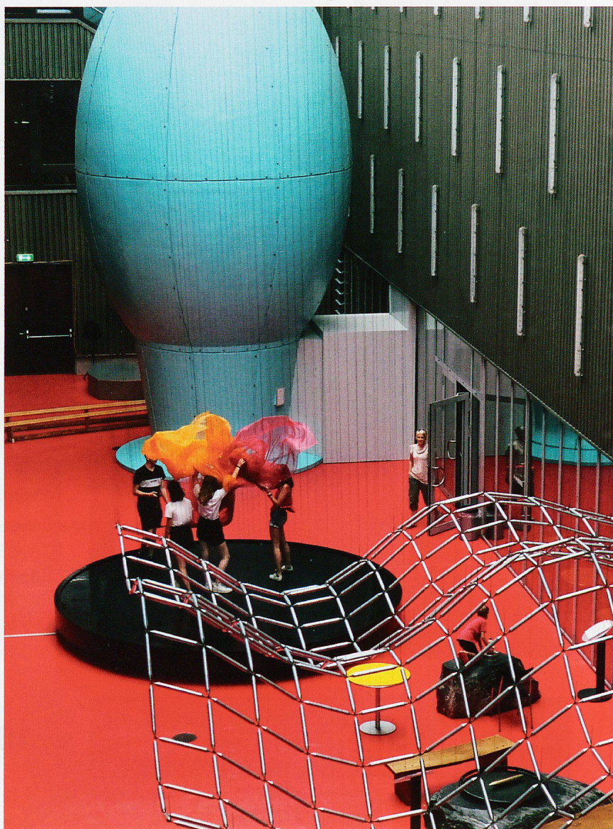
In der Luftfontäne schweben Seidentücher und der hellblaue «Klankkaatser» bietet einen Echoraum.

Um nach der Welt der Illusionen zurück auf den Boden der Wissenschaft zu gelangen, bieten sich die zahlreichen Labore zu den Themen Chemie, Physik und Biologie an. Hier kann man zum Beispiel selber eine geheime Tinte oder Trocken-eis herstellen. Oder man betrachtet durch ein