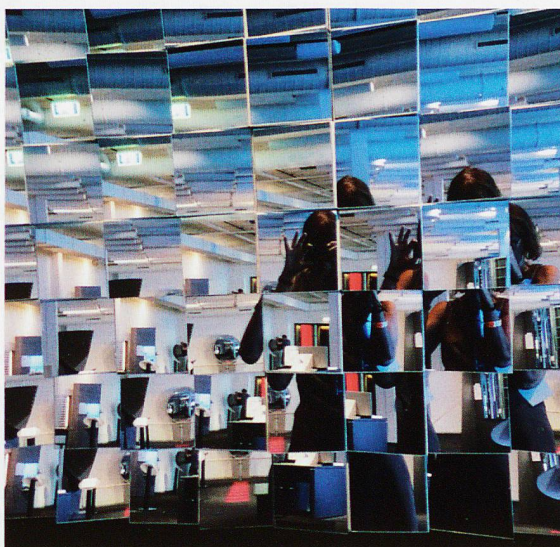
Sonderausstellung «Spiegeleien»: Sich vervielfachen lassen im Doppelbrennpunktspiegel.