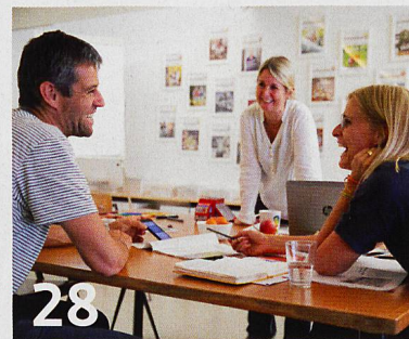
Ein Blick hinter die Kulissen des «Grosseltern»-Magazins.