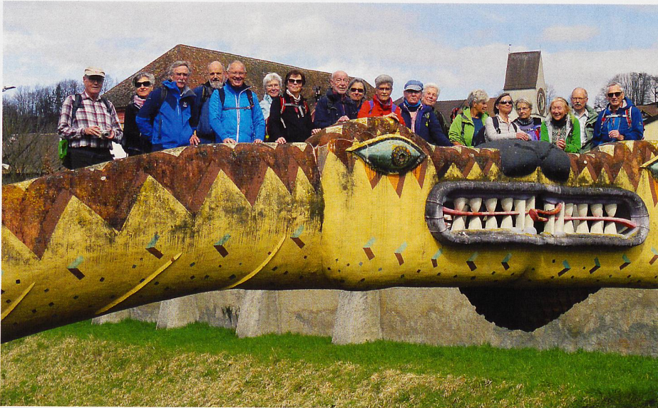
Die Wandergruppe Gossau überquert die Schlangenbrücke von Bruno Weber auf dem Weg in die Altstadt von Klingnau.

heute für mehreren Zugvogelarten Überwinterungsgebiet und Brutstätte.