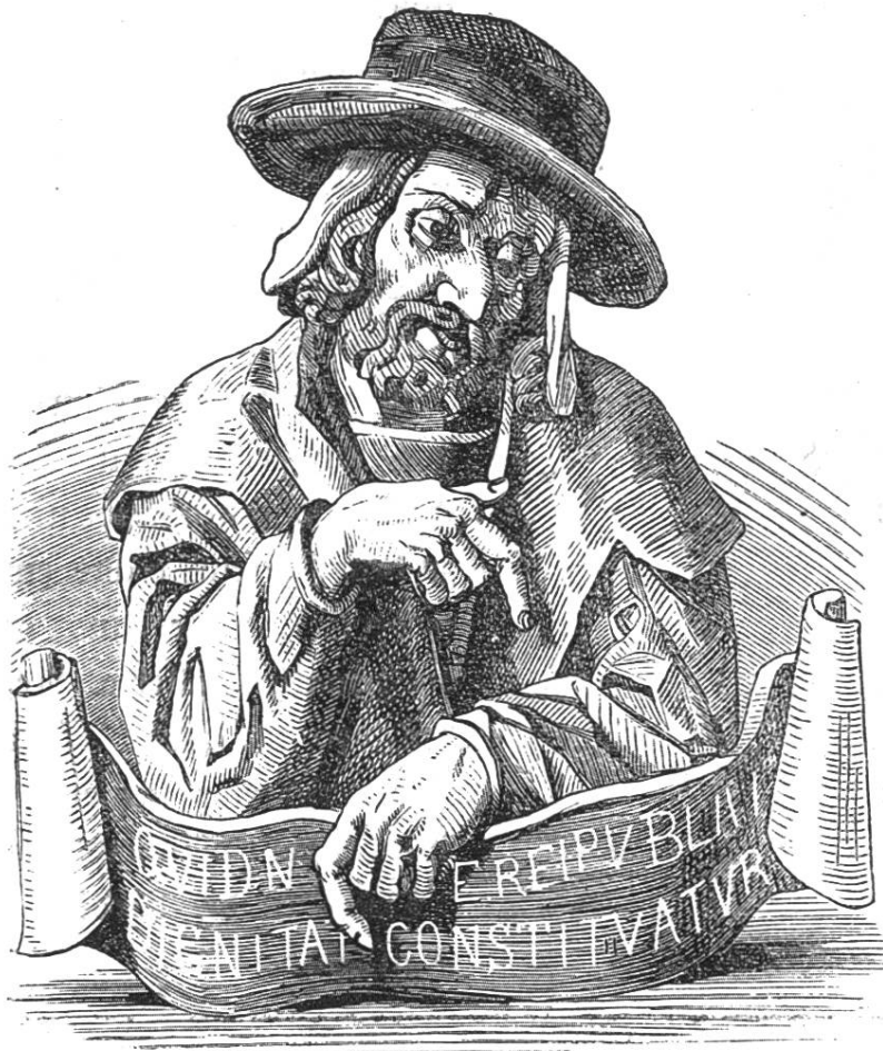
Prophet, hölzernes Bild im Großrathssaale.

Der Bau von 1608 und die daran sich knüpfende innere Ausschmückung des Rathhauses gab Anlaß, auf größere Ordnung und Abstellung verschiedener Mißstände im Hofe des Hauses bedacht zu sein. Um die Gemälde zu schonen, wurden die Harzpfannen an der Rathsstege durch eine Laterne ersetzt. Um „allerley Gefindlin, als Tauner, Landstreicher, welsche Maurer Handwerksgefallen, Lieder- und andere Krämer, welche mit Ops und Anderem viel Unrath verursachten, und die Buben, so sich Spielens und allerley Muthwillens annaßen,“ vom Rathhause fern halten zu können, versah man die drei Bogen gegen den Markt mit eisernen Gitterthoren. Die in der Vorhalle beiderseits stehenden Kramhäuslein wurden beseitigt, in der Meinung, daß „an deren Statt denkwürdige Historien gemalt werden könnten.“ Die denkwürdigen Historien wurden auch wirklich sogleich nachher an diese Wände gemalt: Bock's Bilder, Josaphat und Herodes.