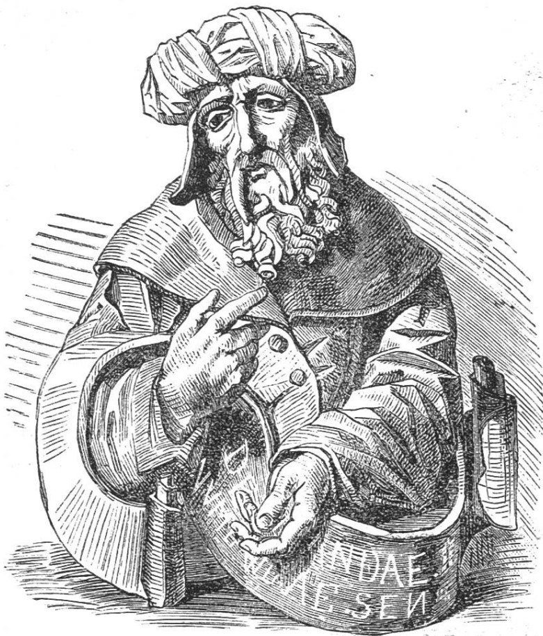
Prophet, Bild im Großrathssaal.

Oben an der Treppe führte links eine Thüre in's Hinterhaus, in den Gang zur Rathsstube und zu dem Höflein, rechts ein niederes „Gätterlein“ in die gemalte Gallerie. Neben der im Jahr 1581 hier errichteten steinernen Wendeltreppe führte die Thüre in die vordere Rathsstube.