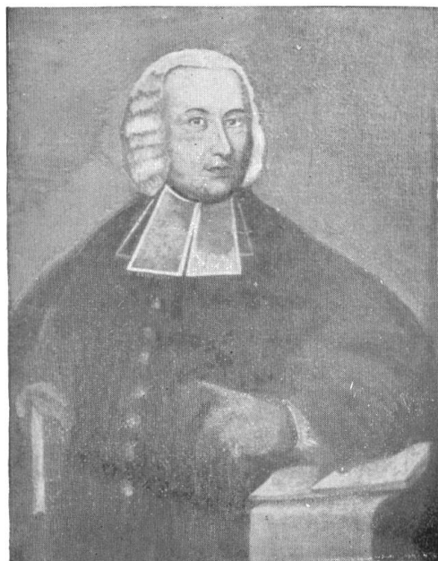
Antonius Tröndlin, Dekan 1739/1778 Pfarrer zu Murg und Erbauer des dortigen Pfarrhauses.