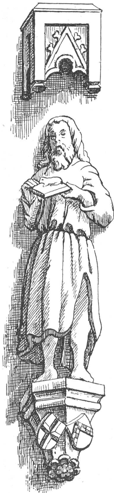
Johannesstatue an der Fassade der Rheinfelder Johanniterkapelle mit dem Johanniterkreuz und dem Wappen des Komturs Johannes Lösel. Um 1436.