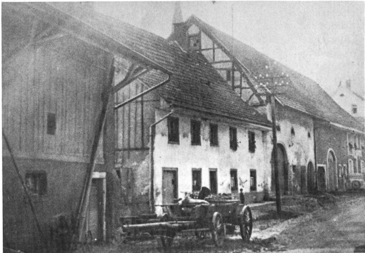
Häusergruppe in Oberschwörstadt von links nach rechts: Haus Nr. 19 (1567) «Zehntstube», Nr. 21 (1735) alte Schmiede und Nr. 23 (1735) Wirtshaus «Zum Hirschen»