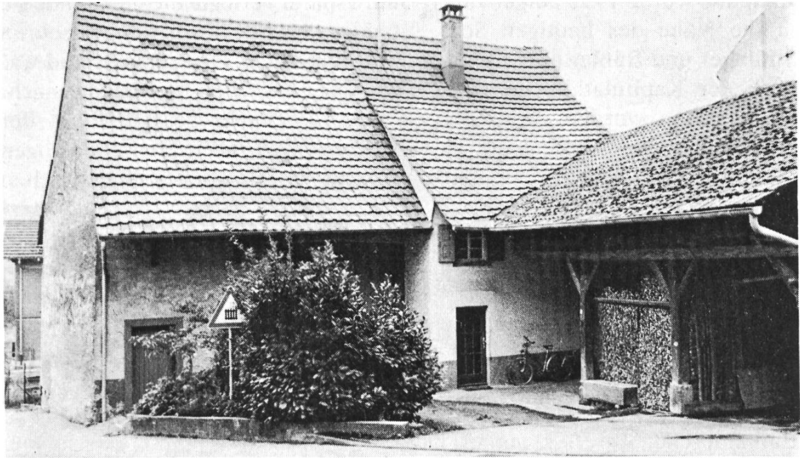
Haus Nr. 165 (1602) Alte Straußwirtschaft in Niederschwörstadt «Dreihirsepl»