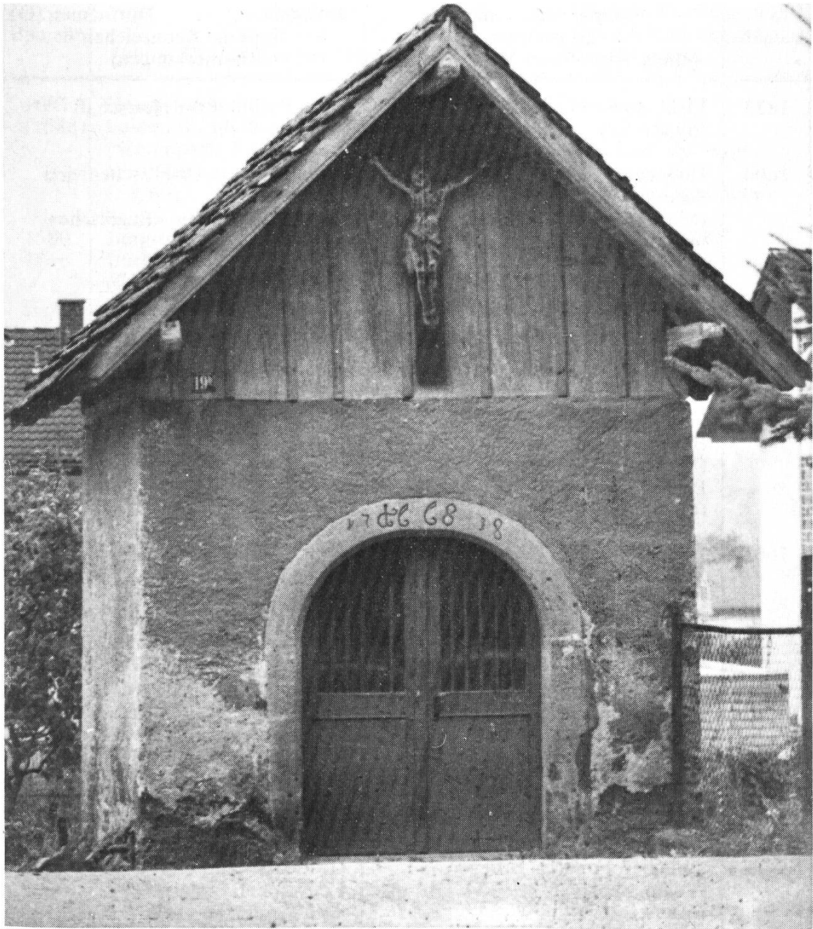
Kapelle in Oberschwörstadt aus dem Jahre 1668 (Nr. 19b, Eigentümer S. Schmidt)