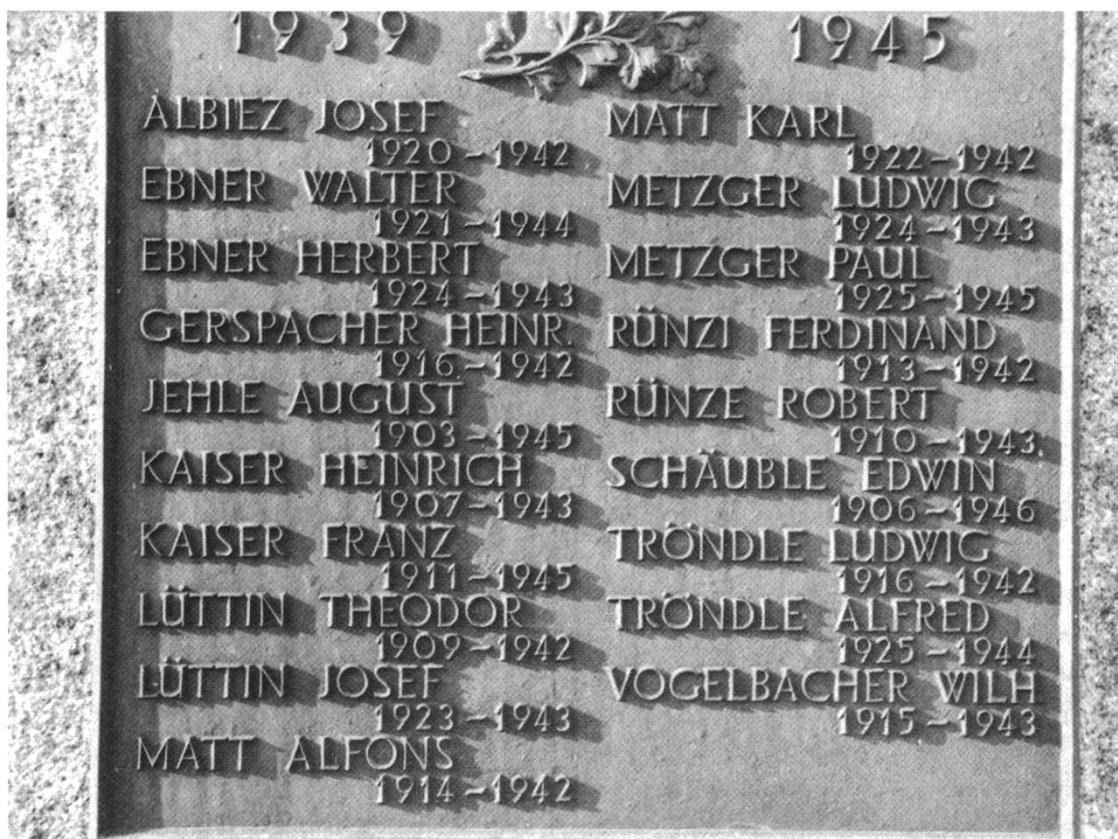
Mahnmal für die Gefallenen in Hochsal

uns Nachdenklichkeit und Dankbarkeit zugleich. Die Zugehörigkeit des Fricktals zu einem Staat, der seine demokratischen und kulturellen Werte in einer düsteren Zeit behauptete, hat die Fricktaler der Schweiz näher gebracht , sie vor dem schlimmen Schicksal des Krieges bewahrt, worunter die badischen Nachbarn noch lange Zeit nach Kriegsende zu leiden hatten. Wenn auch eine gewisse Entfremdung auch heute noch nicht zu übersehen ist, wozu besonders die Veränderung der Bevölkerungsstruktur durch die Flüchtlingsströme beigetragen hat, schufen alte Verbundenheit und die lebendige demokratische Entwicklung der Bundesrepublik einen guten Boden, auf dem die menschlichen, kulturellen und wirtschaftlichen Beziehungen gutnachbarlich gedeihen.