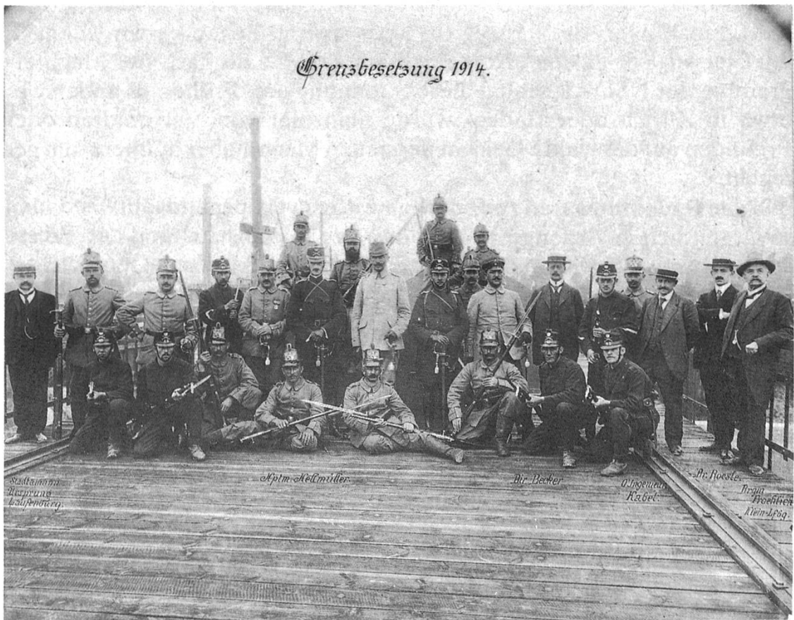
Wo ist der Feind? – Kraftwerk Laufenburg 1914

nehmern gegründeten Textilfabriken in der badischen Nachbarschaft. Der Wegfall der deutschen Binnenzölle, die Wasserkraft der Hotzenwaldbäche und der Bau der Badischen Eisenbahn boten dort ausgezeichnete Bedingungen. Das hatte zur Folge, dass unzählige Fricktalerinnen und Fricktaler jeden Morgen ins Badische marschierten, wo sie ein bescheidenes Auskommen fanden. Trotz der verschiedenen politischen Systeme wurden in dieser Zeit viele gesellschaftliche Beziehungen geknüpft. Gelegentliche Reibereien mit der preussischen Regierung (vgl. Wohlgemuthandel) taten dem guten Einvernehmen keinen Abbruch. Zahlreiche Schweizer wohnten im Badischen, und mancher Fricktaler holte sich am gemeinsamen Fest der katholischen Bevölkerung links und rechts des Rheins, am Fridolinsfest in Säckingen, ein «Wälderwybli» aus dem Hotzenwald. 9 Die rechtsrheinische Nachbarschaft, von Waldshut bis nach Säckingen, gehörte auch zum Einzugsge-