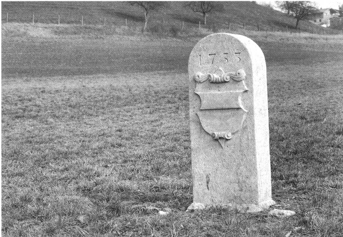
Grenzstein mit dem Österreicher Wappen an der alten Landmarch bei Hornussen

Theresia hatte mit Frankreich einen Frieden ausgehandelt, und ihre Reformen fanden, wie auch jene ihres aufgeklärten Sohnes, Josephs II., hier ihren Niederschlag. Auf den Gebieten der Verwaltung, der Rechtsprechung und der Sozialpolitik war Österreich im späten 18. Jahrhundert wohl ein zentralistisch-absolutes, aber auch ein aufgeklärtes Staatswesen geworden, das die «gottgefällige Gerechtigkeit» und die Menschenwürde zu Richtlinien des staatlichen Handelns erhoben hatte. So wurden die letzten Jahre des Ancien Régime zu einem schimmernden Mythos, der noch lange in die aargauische Zeit hinein leuchtete. 6 Als die französische Revolution an die Tore pochte, brachen hier keine namhaften Unruhen aus. Das jahrhundertealte Dienstverhältnis ging in der Zeit der napoleonischen Kriege zu Ende, und das Ländchen wurde nach einem hoffnungslosen Versuch, einen eigenen Kanton zu bilden, dem Aargau zugeschlagen. Besonders schmerzlich wirkte sich die politische Regelung, die den Talweg des Rheins zur Grenze erhoben hatte, in Laufenburg aus. Das Städtchen wurde getrennt. Das Fehlen einer Brücke (die Rheinbrücke war von Truppen zerstört worden) und die jahrelan-