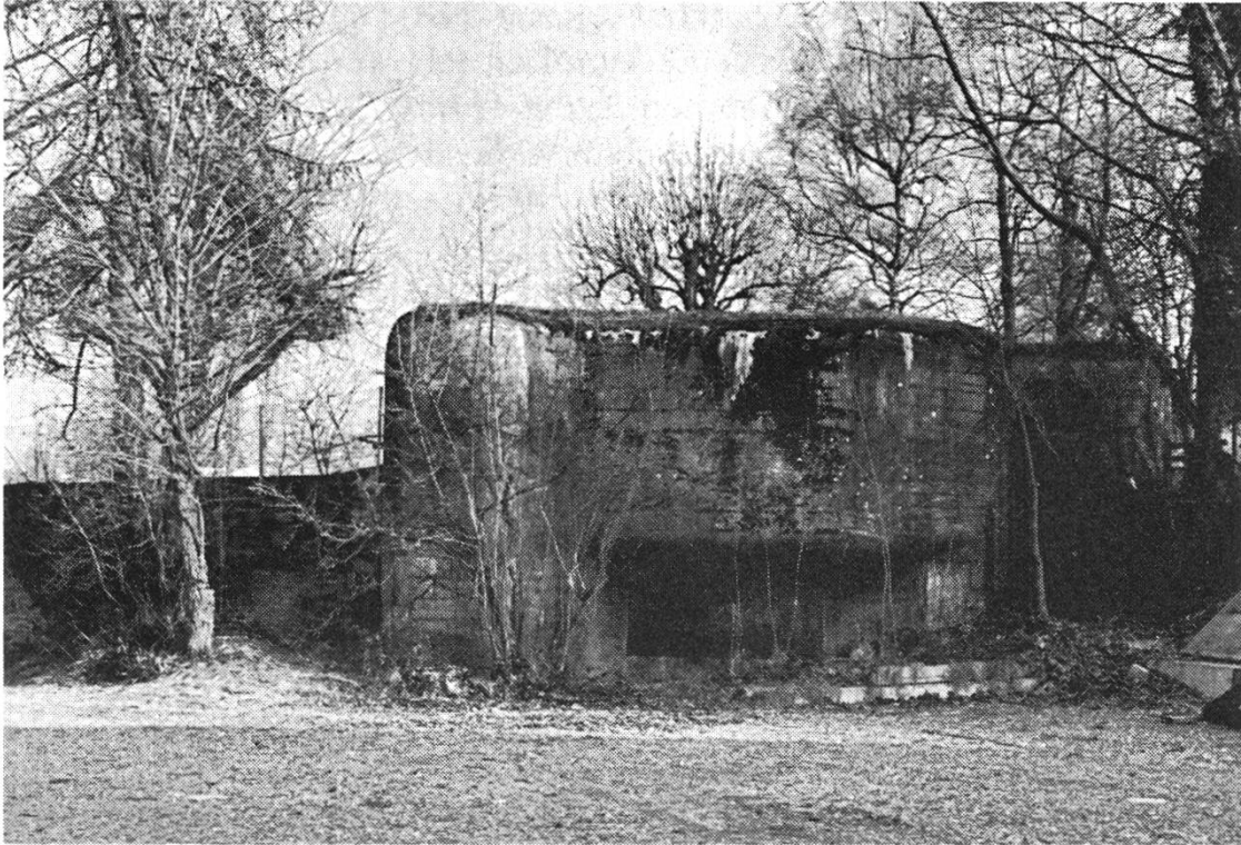
Bunker am Rhein

land orientierte, als Nachrichten über die Judenverfolgungen, die Scheusslichkeiten in den Konzentrationslagern und im Polenfeldzug durchsickerten, als der militärische und wirtschaftliche Würgegriff unser Land umfasste und bedrohte, wuchsen bei uns Furcht und Hass auf alles Deutsche schlechthin. Zur politischen Grenze war nun auch eine menschliche getreten.