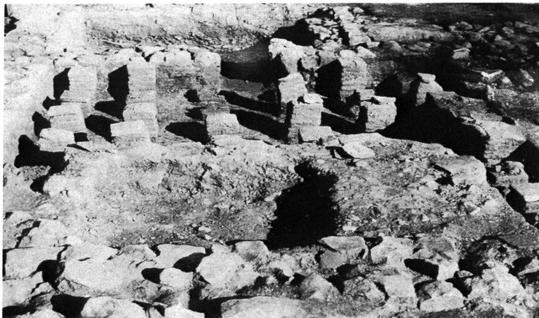
Abb. 10: Ein Teil des römischen Bades von Warmbach. Dieser Raum mit den Hypokaustpfeilern diente als Heisswasserbad, das vom dahinter gelegenen Raum aus beheizt wurde. Ganz im Vordergrund das massive Fundament einer Wasserwanne.

Auf dieses römische Gebäude wies eine Streuung von Ziegelfragmenten und Bruchstücken hin, so dass G. Fingerlin eine Grabung für erfolgversprechend hielt. Deshalb begannen wir Anfang August mit der Anlegung von zwei Suchschnitten, wovon einer die Grundmauern des vermuteten römischen Gebäudes traf. In den folgenden Wochen legten wir dann in einer Flächengrabung die Mauern frei und gruben anschliessend noch zwei sehr gut erhaltene Räume aus. Dabei erwies sich der im Ostteil gelegene kleinere Raum als Heizraum, von dem aus durch eine Maueröffnung (Praefurnium) das westlich anschliessende Heisswasserbad (Caldarium) erwärmt wurde. In diesem befinden sich 29 Hypokaustpfeiler, die z. T. noch bis zu neun Lagen erhalten sind, sowie das massive Fundament einer Wasserwanne (Abb. 10).