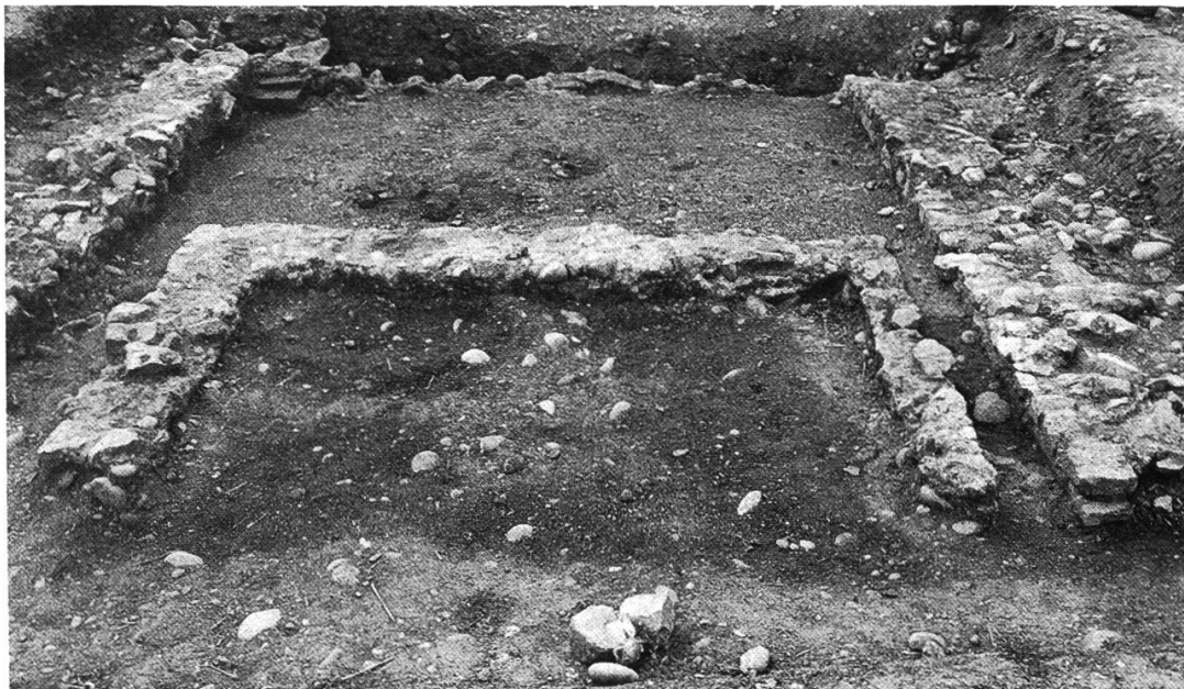
Abb. 9: Die noch am besten erhaltene Südostecke des Gebäudes. Die Funktion der hier gelegenen Räume kann nicht mehr genau bestimmt werden.