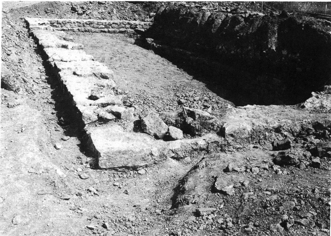
Abb. 1: Der in der Trasse der Heideggerstrasse liegende Gebäudeteil. Die im Vordergrund sichtbare beschädigte Stelle zeigt an, wo der Bagger im letzten Augenblick die Mauer getroffen hatte.

In den folgenden zwei Wochen legten wir dann diesen Teil vollständig frei, wobei wir neben zahlreichen Keramikbruchstücken auch einen Kalksteinmörser mit Stössel, ein Querbeil (Dechsel) und ein Messer fanden. Bei unserer Grabung stiessen wir an der südlichen Trassenkante auch auf eine Zwischenmauer, vor der eine grosse Herdstelle angebracht war. Ausserdem stellten wir eine Brandschicht fest, die durch den ganzen freigelegten Teil des Gebäudes verlief, so dass dieses ein gewaltsames Ende gefunden haben muss. Die Mauern dieses Gebäudeteils sind leider