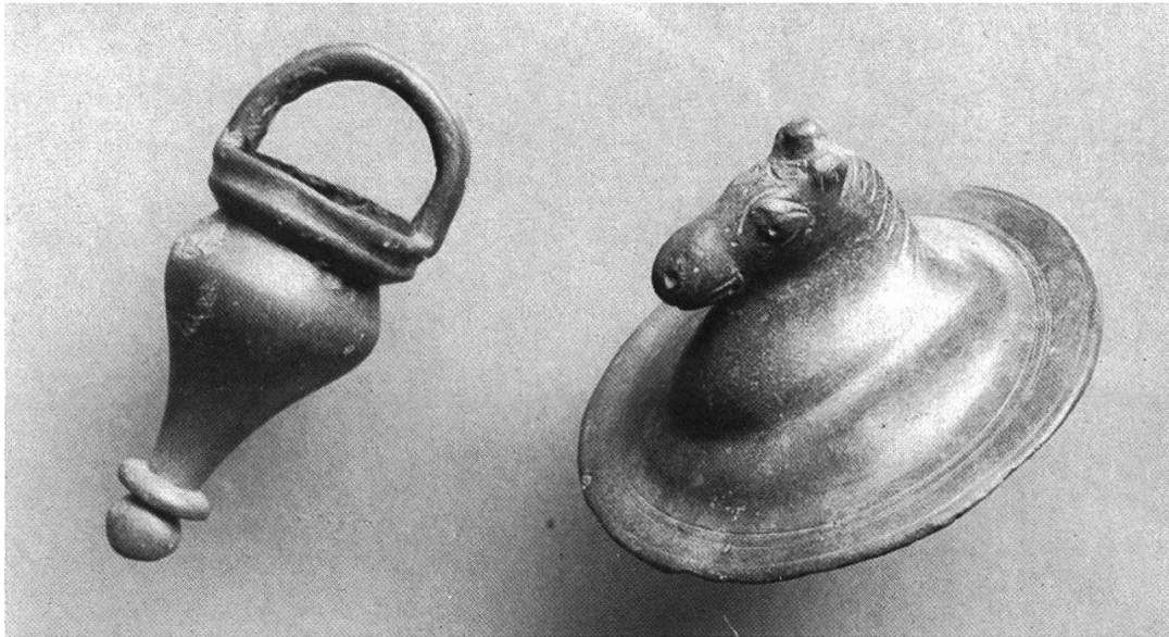
Abb. 4: Römische Gussarbeiten aus Bronze.

Keramik findet, ist dieser Schadenbrand kaum den im 3. Jahrhundert einwandernden Alamannen anzulasten. Ein überhitzter Ofen kann ebenso gut die Ursache dafür gewesen sein, dass uns der Wyhlener Boden diese wertvollen Kleinbronzen römischer Zeit überliefert hat.» 2)