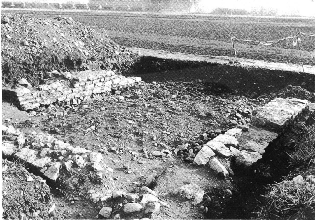
Abb. 6: Das römische Ökonomiegebäude im Beuggener Gewann «Steinacker» nach seiner vollständigen Freilegung. Die Südseite des Baues ist bei den Baggerarbeiten für die Rheinfelder Abwasserleitung zerstört worden.