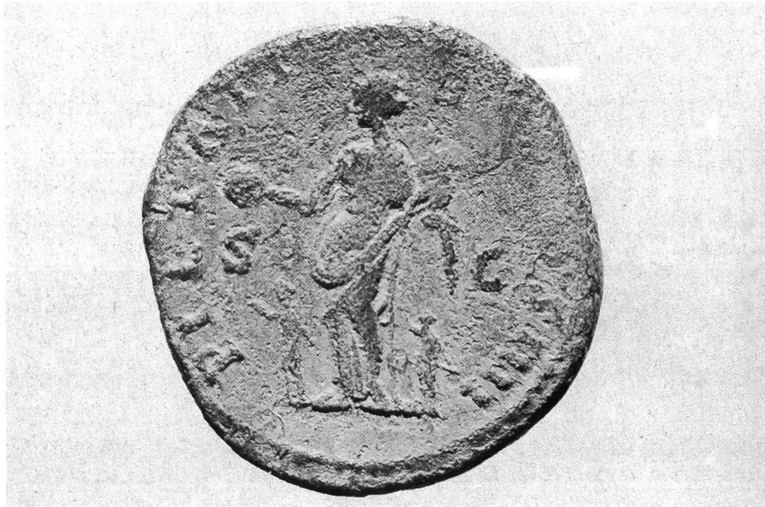
Abb. 8: Rückseite: Die Göttin Pietas, welche in der Rechten einen Globus hält.