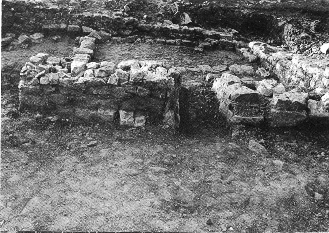
Abb. 3: Der Bereich des Brennofens, in den ein mit Sandsteinplatten eingefasster Heizkanal führt.

Eisengerätschaften und zwei möglicherweise zum Einschmelzen bestimmte Bronzegegenstände sprechen dafür, dass hier Metall verarbeitet wurde. Während sich unter den landwirtschaftlichen (Haumesser) oder handwerklichen Eisengeräten (Axt, Querbeil) keine auffälligen Stücke befanden, stellen die beiden Kleinbronzen ungewöhnliche und seltene Fundstücke dar. Die flachgewölbte Scheibe mit dem massiven vollplastischen Pferdekopf gehörte zu einem dekorativen Zaumzeug, der kräftig profilierte Anhänger war vermutlich mit einem Lederriemen am Aufbau eines römischen Reisewagens befestigt. Nahebei gefundene Reste eines eisernen Nabenrings könnten dafür sprechen, dass dieser Wagen oder Teile davon in die Werkstatt gebracht wurde, zur Reparatur oder zur Wiederverwendung der noch brauchbaren Metallteile. Die Erhaltung dieser beiden «Kabinettstücke» ist wohl dem verheerenden Feuer zu danken, das den ganzen Bau in Schutt und Asche legte. Anders wären diese Stücke von damals beträchtlichem Materialwert kaum unbenutzt liegen geblieben. Da sich unter den zahlreichen Scherben keine ausgesprochen späte