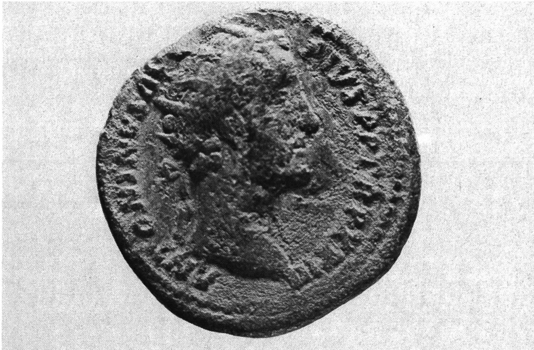
Abb. 7: Vorderseite: Der Kaiser Antoninus Pius mit Strahlenkrone.

Auf der Rückseite der Münze erkennt man die Göttin Pietas, die in der Rechten einen Globus hält und auf dem linken Arm ein kleines nacktes Kind trägt. Neben ihr stehen ausserdem zwei Mädchen, die — wie das kleine Kind — zum Kaiserhaus gehören (Abb. 8).