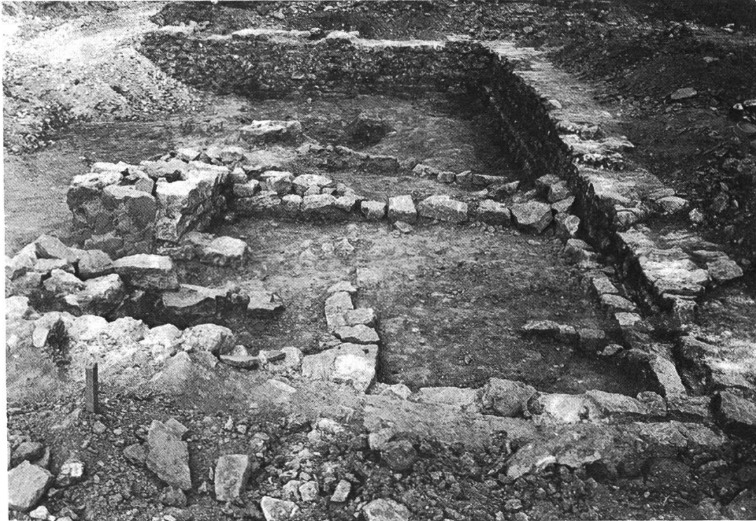
Abb. 2: Der im benachbarten Grundstück freigelegte Bereich des Hauses. Links oben kann man erkennen, dass der in der Strassentrasse liegende Teil bereits wieder mit Kies zugeschüttet ist.

durch den Baggerführer um etwa 30 cm abgetragen worden, so dass nur noch die letzten 3—4 Steinlagen erhalten waren.