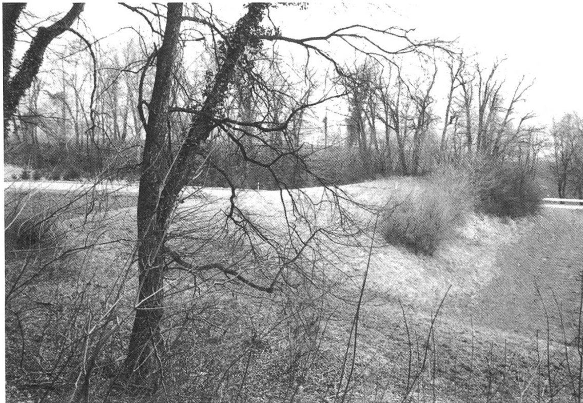
Abb. 1: Die noch etwa 40 m lange Schwedenschanze an der Strasse nach Minseln

ihm das Herzogtum Franken als schwedisches Lehen übertragen. Nach der Eroberung Regensburgs erlitt er 1634 bei Nördlingen eine schwere Niederlage, durch die er Franken wieder verlor. Daraufhin schloss er mit Richelieu am 27.10.1635 den Vertrag von Saint-Germain-en-Laye und trat in französische Dienste ein. Dafür wurden ihm die Landgrafschaft Elsass und die Landvogtei Hagenau in Aussicht gestellt.