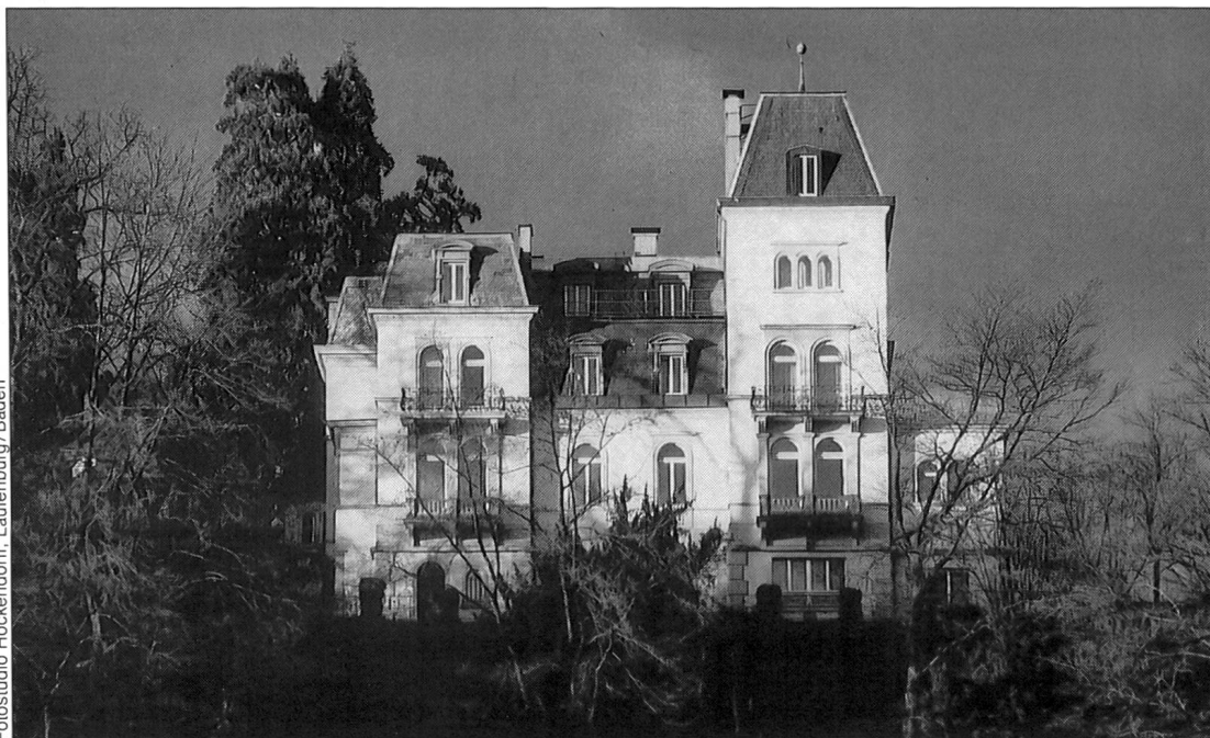
Abb. 3 Das «Schlössle» in Kleinlaufenburg in der Abendsonne.