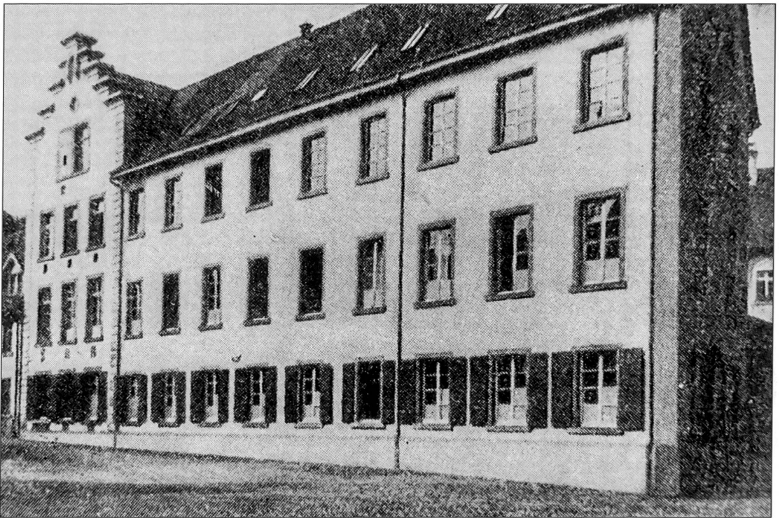
Repro: Marco Schwarz 2