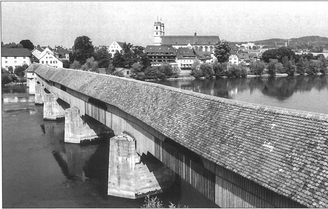
Abb. 1 Die historische Rheinbrücke Bad Säckingen– Stein/Kanton Aargau. Vor 150 Jahren: Flucht- und Rückkehrweg der Revolutionäre.

tenteils bewaffnet, versammelt 2 . Ähnliche Szenen spielten sich in den benachbarten Orten ab.