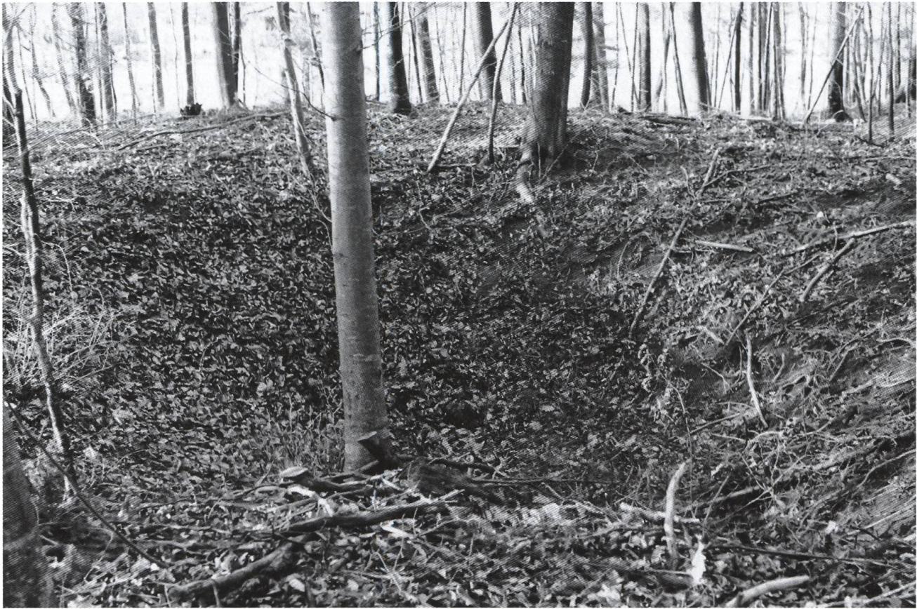
Abb. 9: Spuren einer Erzgrube im Junkholz bei Wölflinswil CH. Der Abbau von eisenhaltigem Gestein auf den Hochflächen des Tafeljuras lässt sich seit dem frühen 13. Jahrhundert schriftlich belegen, setzte aber wohl schon bedeutend früher ein.

Grubenwerk und an der Feste Homberg zu verzichten. Die Burg Heinrichs von Kienberg wurde geschleift und durfte im Umkreis einer Meile (Bannmeile) während zwanzig Jahren durch keine anderen Befestigungsanlagen ersetzt werden. 33