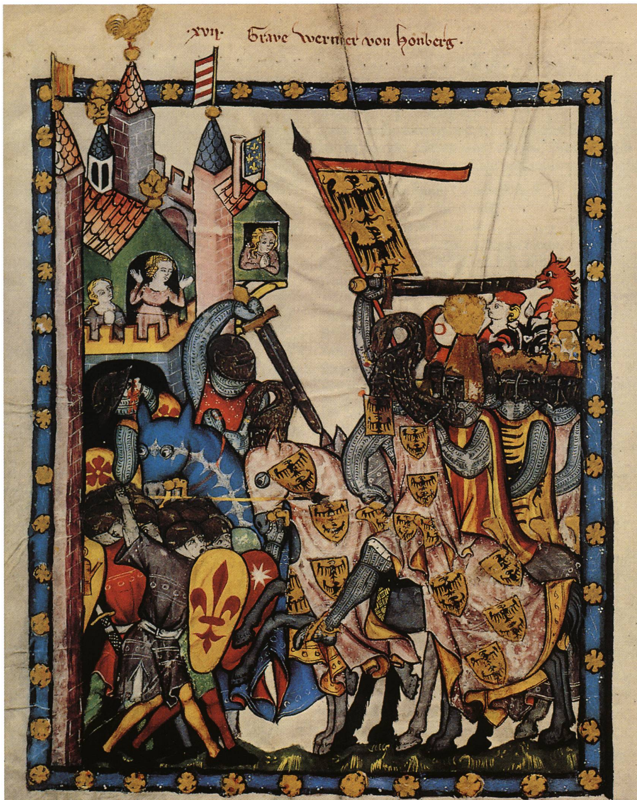
Abb. 10: Graf Wernher von Homberg. Die Miniatur aus der manessischen Liederhandschrift zeigt den Generalkapitän Kaiser Heinrichs VII. mit seinem Gefolge bei der Erstürmung der Stadt Soncino, die in zahlreichen italienischen Chroniken einen Niederschlag fand. Werners Waffenrock und die Couvertüre seines Pferdes sind mit dem hombergischen Wappen besetzt, das in Gold zwei übereinander schwebende schwarze Adler zeigt. Als Helmzier trägt er die beiden Schwanenhälse, das Emblem der Grafen von Rapperswil. (Bild: Codex Manesse, Universitätsbibliothek Heidelberg DE)