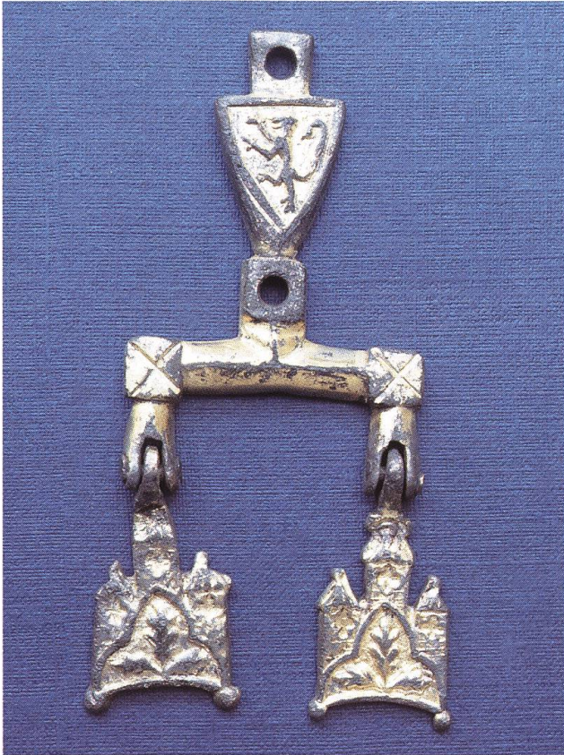
Abb. 8: Alt-Homberg CH, vergoldeter Schmuckanhänger. Der kleine Wappenschild mit dem nach links gewendeten steigenden Löwen weist auf das Umfeld der Grafen von Habsburg-Laufenburg hin, die seit 1354 über die Feste auf dem Homberg verfügten. Für eine Entstehung in dieser Zeitstellung sprechen auch die beiden stilisierten Burgen, die an Scharnieren befestigt sind. Zusammen mit einer Reihe weiterer Metall- und Keramikfunde macht der Schmuckgegenstand deutlich, dass auf dem Adelsitz seit dem frühen 13. Jahrhundert ein zunehmend repräsentativer Lebensstil geführt wurde.

Mutter gegen Ende des 12. Jahrhunderts die Feste Neu-Tierstein.