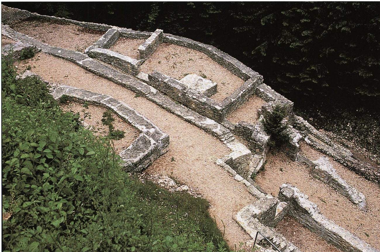
Abb. 5: Ruine Alt-Tierstein CH. Die ältesten Teile der auf drei Terrassen angelegten Burg dürften bereits im 11. Jahrhundert entstanden sein. Die weitgehend verschütteten Mauerzüge wurden 1934/35 freigelegt und konserviert.

Klosterverbandes lagen. Die enge Beziehung zwischen diesen Eigenkirchen kam über das Mittelalter hinaus darin zum Ausdruck, dass die Geistlichen, dem Willen der gräflichen Stifter gemäss, bestimmte Jahrzeiten gemeinsam in der Fricker Pfarrkirche St. Peter und Paul begingen. 28