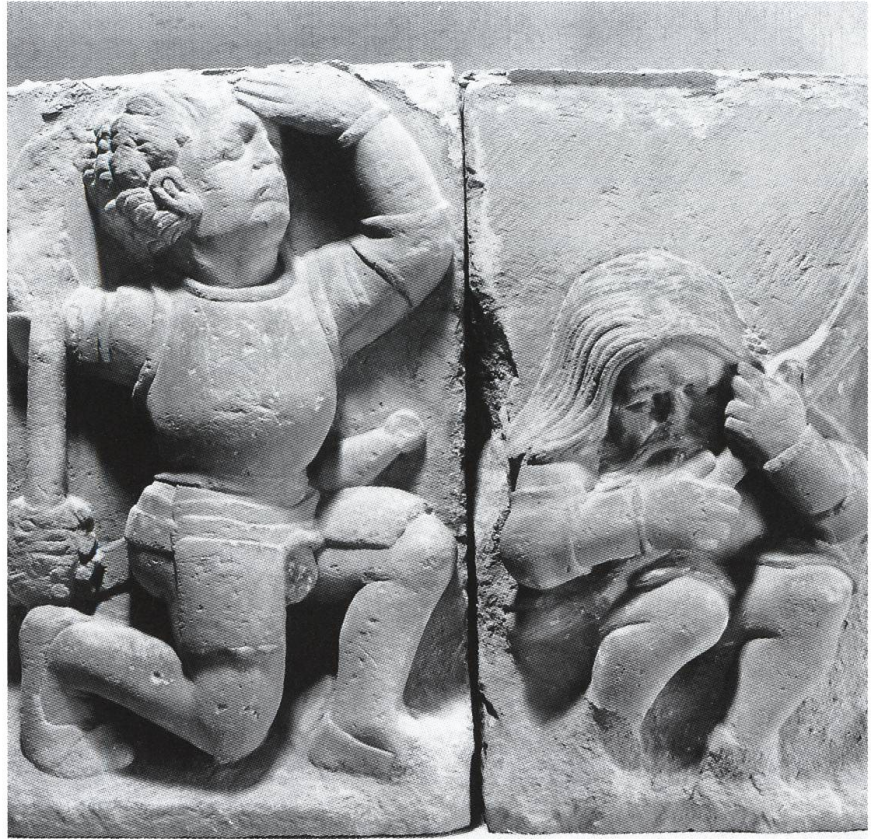
Abb. 7: Alt-Homberg CH, Reliefplatten aus rotem Sandstein, die offenbar zu einer Heilig-Grab-Darstellung in der ehemaligen Burgkapelle gehörten. Während des Erdbebens von Basel erlitt die Wehranlage im Oktober 1356 beträchtliche Schäden, blieb aber weiterhin bewohnt und wurde zumindest teilweise erneuert. Diese baulichen Massnahmen konnten jedoch den allmählichen Zerfall der Höhenburg nicht aufhalten, die ihre Bedeutung im 14. Jahrhundert verlor.

Sisgau. Das Dynastengeschlecht konnte damit seinen Einflussbereich wesentlich erweitern und verfügte nun über zusätzliche hoheitliche Abgaben wie Zoll- oder Gerichtseinkünfte. 29 Von erheblicher wirtschaftlicher Bedeutung blieben jedoch die Wölflinswiler Erzgruben. Sie sind zwar erst seit dem Beginn des 13. Jahrhunderts schriftlich fassbar, wurden aber zweifellos schon viel früher ausgebeutet. 30 Neben der Landgrafschaft im Sisgau übte Rudolf von Homberg-Tierstein seit 1102/03 die Schirmvogtei über die linksrheinischen Güter des neu gegründeten Kluniazenserpriorates St. Alban in Basel aus und war als Hochvogt des Bistums tätig. Die Familie war in diesem Zeitraum besonders eng mit der Basler Diözese verbunden, stand ihr doch zwischen 1097/98 ein gleichnamiger Verwandter Rudolfs von Homberg-Tierstein vor. Bischof Rudolf von Homberg weilte zwar oft in der Umgebung des Kaisers, fühlte sich aber grundsätzlich eher der päpstlichen Position verpflichtet. Er bemühte sich offenbar stark um die Belange kirchlicher Institutionen, insbesondere der