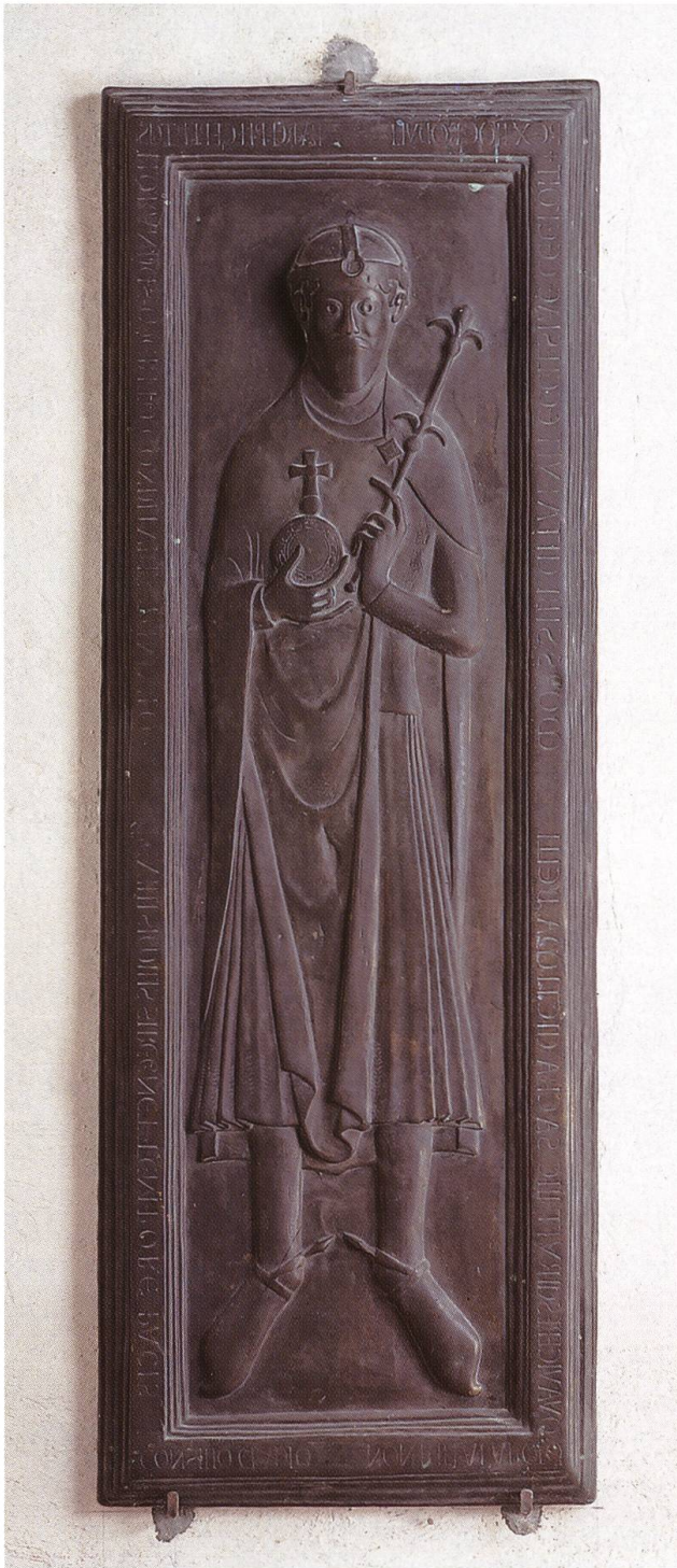
Abb. 3: Rudolf von Rheinfelden. Die Grabplatte des 1080 als Gegenkönig verstorbenen Herzogs von Schwaben im Dom zu Merseburg in Sachsen-Anhalt gilt als frühestes Werk romanischer Bronzgießerei im deutschsprachigen Raum. Die Inschrift rühmt den für das Gesetz der Väter gefallenen König, dem seit Karl dem Grossen keiner mehr gleichgekommen sei. (Eine Kopie des Grabmales befindet sich in der Johanniterkapelle Rheinfelden).

Hand verloren hatte, mit der er einst seinem Schwager und Lehensherrn Heinrich IV. Treue geschworen hatte. Rudolfs Sohn Berthold, den die päpstliche Partei drei Jahre zuvor zum Herzog von Schwaben erhoben hatte, konnte die Ereignisse nicht mehr wesentlich mitbestimmen. Nach seinem Tod im April 1090 fand er wie seine Mutter Adelheid von Turin und sein früher verstorbener Bruder Otto in der Familiengrablege im Kloster St. Blasien seine letzte Ruhestätte.