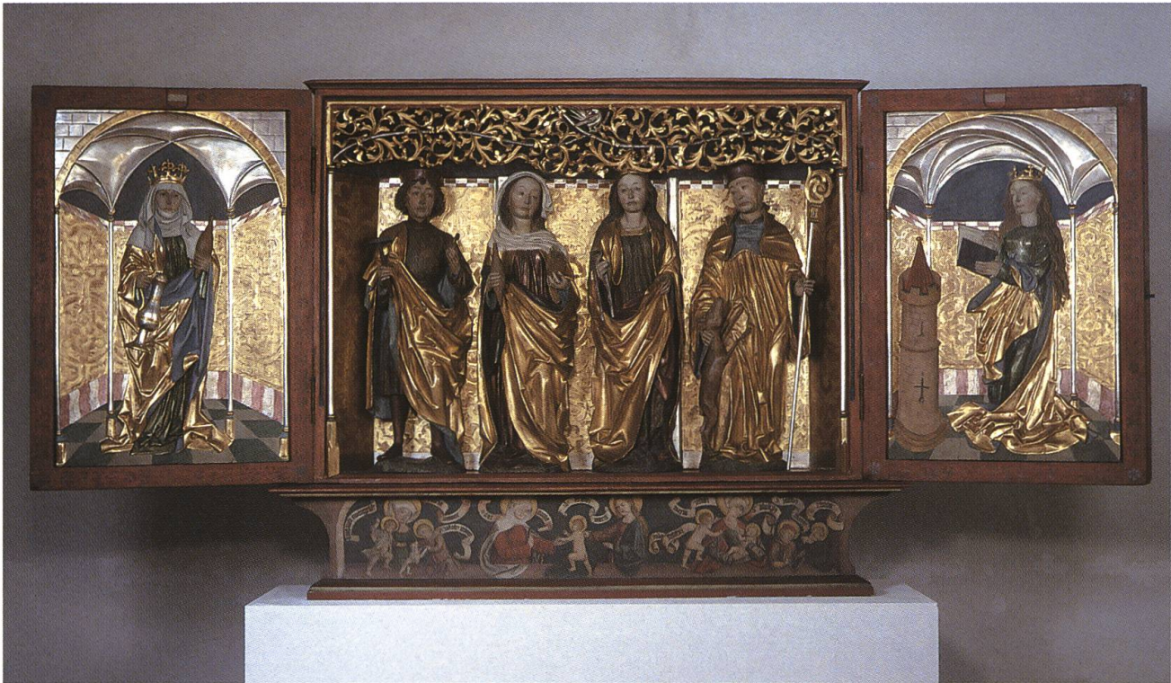
Abb. 11: Herznach CH, Kapelle St. Verena. Der Flügelaltar, der zu den bedeutendsten Werken gotischer Schnitzkunst im Fricktal zählt, entstand vermutlich um 1516 in einer Basler Werkstatt.

me bilden Figuren, die zum gotischen Ausstattungsbestand der Rheinfelder Stiftskirche St. Martin gehörten. Der ursprüngliche Aufstellungsort der Madonnenstatue und der Königsdarstellungen ist nicht bekannt. Die Werke, die im Rahmen der letzten Aussenrestaurierung in Kopien wieder am Giebel der Vorhalle vereinigt wurden, dürften jedoch als Anbetungsgruppe Teil eines Figurenportals gebildet haben. Zusammen mit dem Relief des hl. Martin wurden die individuell gestalteten Figuren wohl im dritten Viertel des 15. Jahrhunderts durch eine Werkgruppe geschaffen, die mit der Basler Münsterbauhütte in Beziehung stand (Abb. 10). 21