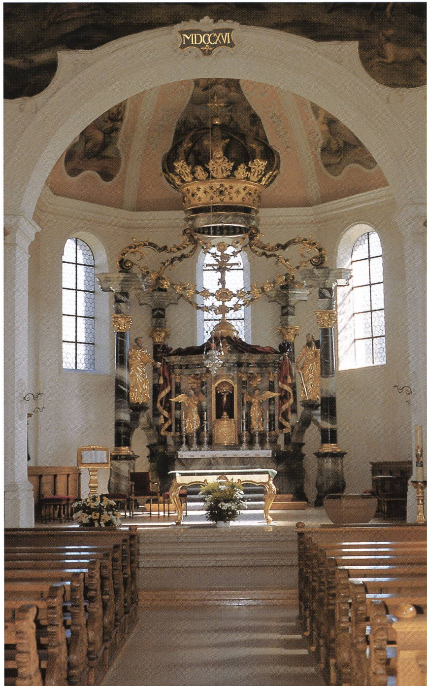
Abb. 28: Frick CH, Pfarrkirche St. Peter und Paul. Der Raumeindruck der Fricker Pfarrkirche gipfelt im kuppelgewölbten Chorbereich. Hier hat der Erfindungsreichtum barocker Rauminszenierung im Hochaltar – einem lichten, von einer Spangenkronen überhöhten Säulenbau – einen vollendeten Ausdruck gefunden.

gehäuse begleiten vier korinthische Säulen mit konzentrisch emporstrebenden Aufsatzvoluten, die eine mächtige Spangenkronen tragen. Der schwungvoll inszenierte Baldachin birgt zwischen den schräg gestellten Säulenpaaren die lebensgrossen Statuen der Kirchenpatrone Petrus und Paulus. Wie ein kostbar gearbeiteter Schrein fügt sich der Säulenbau in den lichterfüllten Chorraum ein und setzt in der vielstimmigen Ausstattungskomposition einen voll klingenden Schlussakkord (Abb. 28).