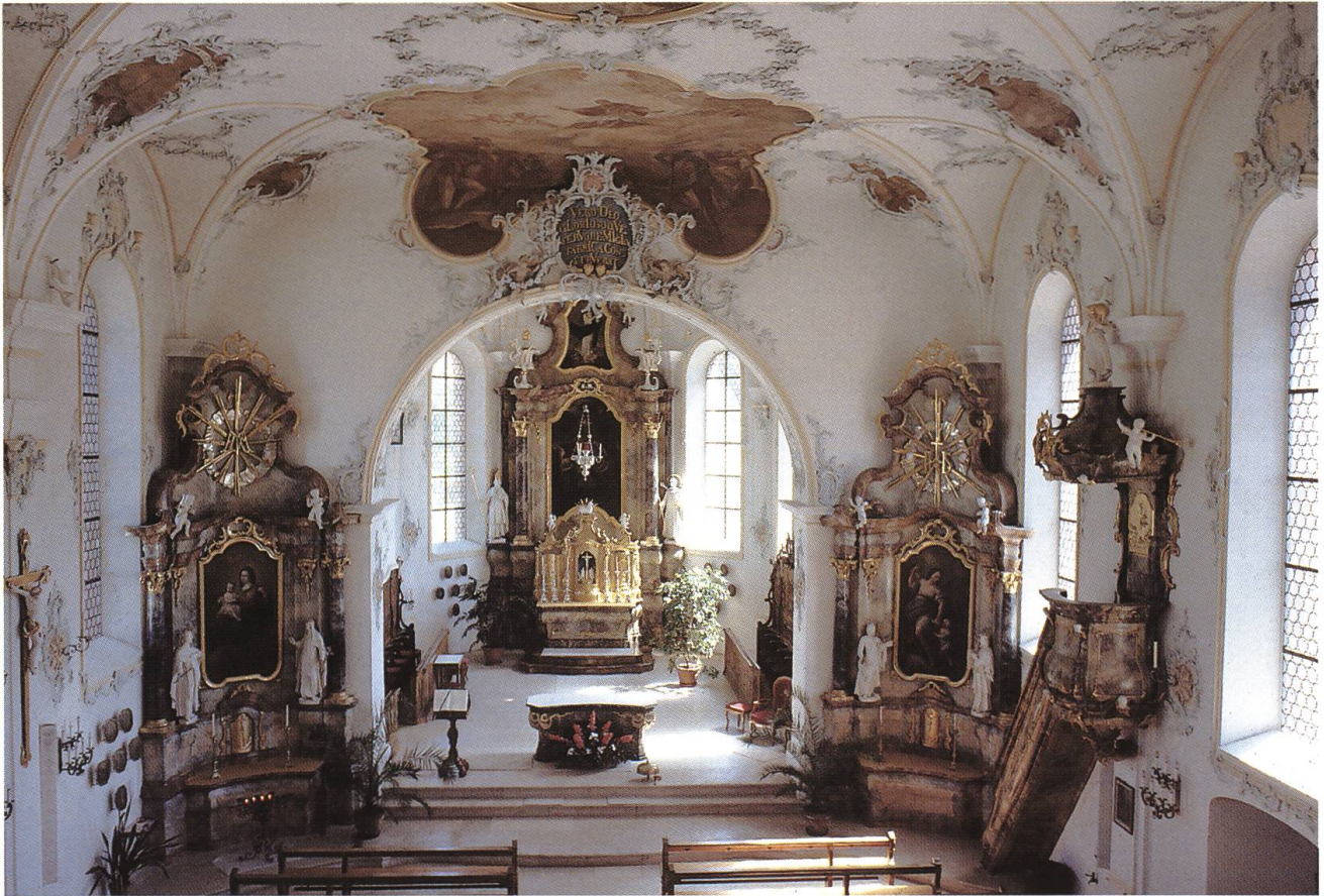
Abb. 29: Mettau CH, Pfarrkirche St. Remigius. Die beschwingte Eleganz der Formen und der gleichschwebende Zusammenklang der Farbtöne vereinigen sich im 1775 vollendeten Kirchenraum zu einem festlichen Akkord spätbarocker Ausstattungskunst.

stilen präsentiert sich der Hochaltar der Laufenburger Stadtkirche St. Johann, der zwischen 1770 und 1772 in das Chorpolygon eingefügt wurde. Die spielerische Sprache des Rokoko, die sich kühn geschwungener Stege und Voluten bedient, gewinnt vor den hohen spätgotischen Masswerkfenstern an Aussagekraft. Die Vereinigung von Raum, Farbe, Form und Licht zum barocken Ideal eines vielstimmigen harmonischen Gesamtklanges konnte nur im Zusammenspiel verschiedener günstiger Voraussetzungen Gestalt gewinnen. Neben ausgewiesenen Kunsthandwerkern war die Realisierung dieser kulturellen Höchstleistungen vor allem auch von einer hohen materiellen Leistungsbereitschaft der Bauherrschaft abhängig. Die Talpfarre Mettau gehörte zu den einträglichsten Pfründen des Stiftes Säkingen. Bereits 1670 war auf Kosten der Kirchgemeinde ein