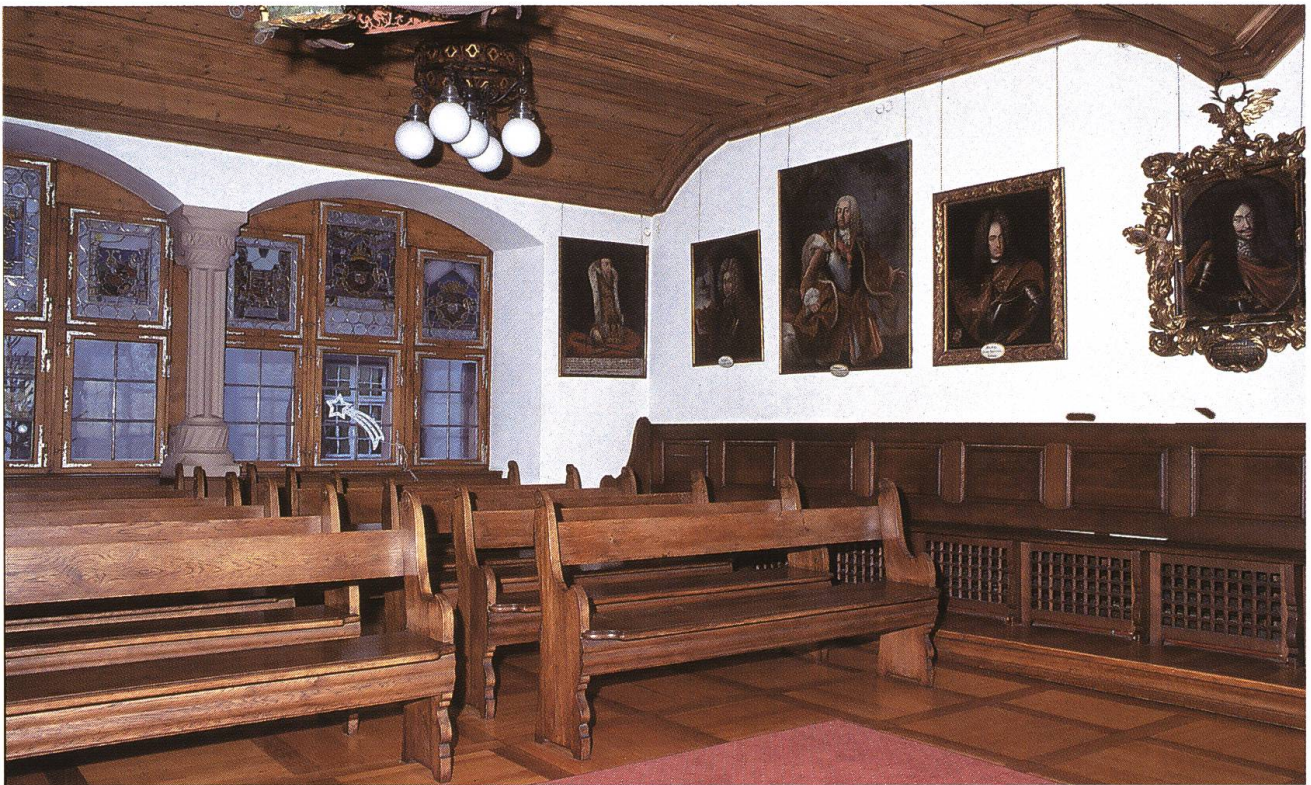
Abb. 15: Rheinfelden CH, Rathaus. Mit Ausnahme der Möblierung und der später hinzugefügten Fürsten- und Bürgerbildnisse hat der grosse Ratssaal im ersten Obergeschoss des Rheinfelder Rathauses sein spätgotisches Aussehen aus der Zeit des Neubaus von 1531 weitgehend bewahrt. An den Längswänden öffnen sich säulengestützte Staffelfenster, in die eine Folge bemerkenswerter Kabinettscheiben eingefügt ist. Die Werke, die 1532/33 und 1581 gestiftet wurden, entstanden möglicherweise in Basler Werkstätten.

befinden. Auf der Evangelienseite des Chorboogens im Säckinger Münster steht eine in spätgotischer Zeit entstandene Statue des heiligen Fridolin. Wie die um 1550 geschaffenen sechs Relieftafeln, die wichtige Stationen aus der Vita des irischen Wandermönchs festhalten, bildete die lebensgrosse Plastik wohl ursprünglich Bestandteil eines Altarschreines. 27