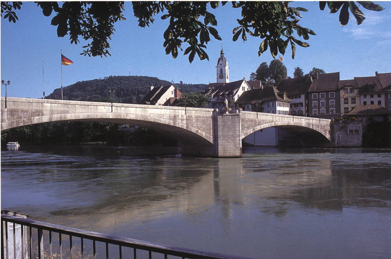
Abb. 34: Laufenburg, Rheinbrücke. In eleganten Bögen verbindet die Konstruktion Eduard Maillarts die beiden Teile der Altstadt. Der Flussübergang entstand zwischen 1910 und 1912 im Zusammenhang mit dem Bau des Kraftwerks, der die Rheinlandschaft tief greifend veränderte.

reits im folgenden Jahr wurde der Betrieb der Brauerei Feldschlösschen auf das Areal unweit des neuen Bahnhofes verlegt. Hier entstand in mehreren Ausbautetappen eine der architektonisch interessantesten Industrieanlagen im Gebiet zwischen Jura und Schwarzwald. Auf einer leichten Anhöhe gelegen, beherrscht der ausgedehnte Gebäudekomplex die vorgelagerte Ebene des Rheintales. Die Fassaden der historisierenden vielgliedrigen Schlossbauten werden durch den Wechsel von gelben und roten Ziegelsteinen geprägt. Zahlreiche fiolenartige Turmaufsätze und zinnenbekrönte Balustraden verleihen dem differenziert gestalteten Ensemble eine unverwechselbare Silhouette. Im Innern wurde das Sudhaus als eigentlicher Repräsentationsraum konzipiert. Die geräumige Halle, die von den sechs kupfernen Braupfannen beherrscht wird, zeich-