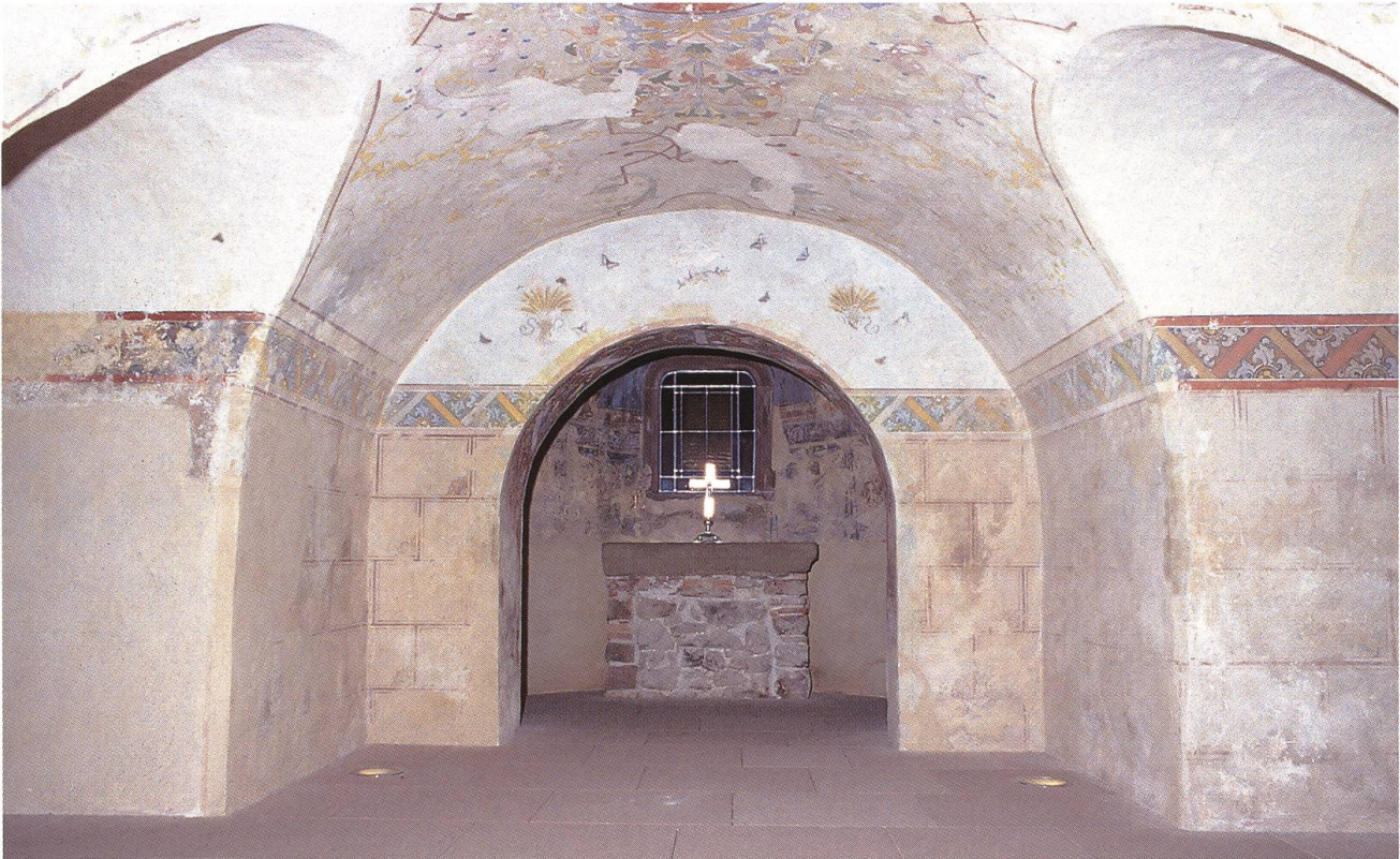
Abb. 3: Bad Säckingen DE, St.-Fridolins-Münster, Hauptraum der Krypta gegen Osten. In der Apsis hinter dem nachträglich eingefügten Triumphbogen befindet sich ein gotischer Blockaltar, der im 19. Jahrhundert vergrößert wurde. Die Dekorationsmalereien entstanden um 1887.

entsprach dem Leitbild alamannischer Adelliger, die im Gekreuzigten den siegreichen König und tapferen Überwinder des Todes verehrten (s. Beitrag Brogli/Maise: Kult und Religion in der Ur- und Frühgeschichte, Abb. Grabplatte Frick). 6