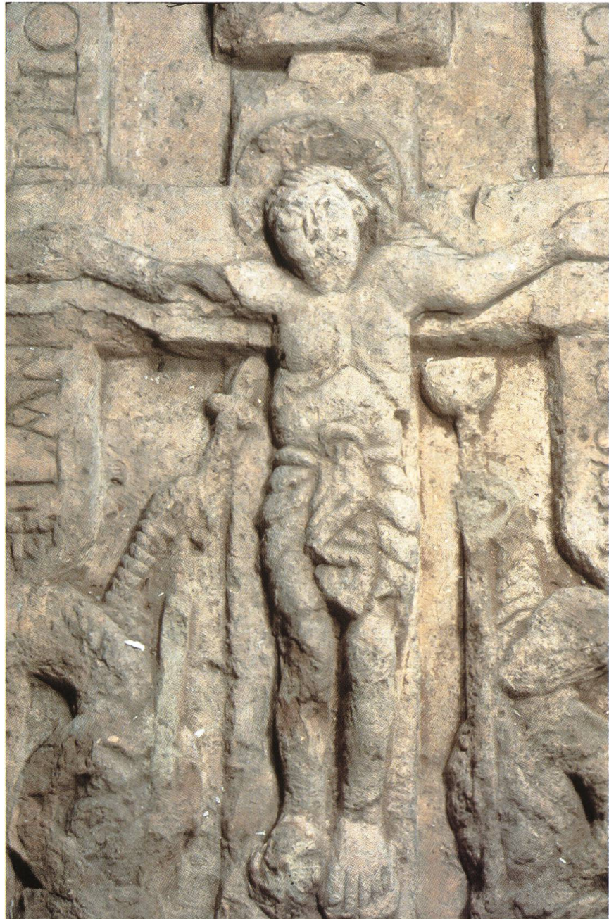
Abb. 5: Herznach CH, Kapelle St. Verena, Kreuzigungsrelief. Die Darstellung, die 1904 im Rahmen von Renovationsarbeiten gefunden wurde, dürfte um die Mitte des 10. Jahrhunderts entstanden sein. Die begleitende Inschrift weist das Werk als Stiftung des Basler Bischofs Landelous aus.

neuer Kirchen. Die seit dem 7. und 8. Jahrhundert errichteten Sakralbauten entstanden hauptsächlich als Eigenkirchen klösterlicher oder adeliger Grundherren. Wie in Obermumpf, wo das älteste nachweisbare Gotteshaus über den Grundmauern eines römischen Gutshofes entstand, fanden bei den Neugründungen gelegentlich auch antike Bauteile wieder Verwendung. 12