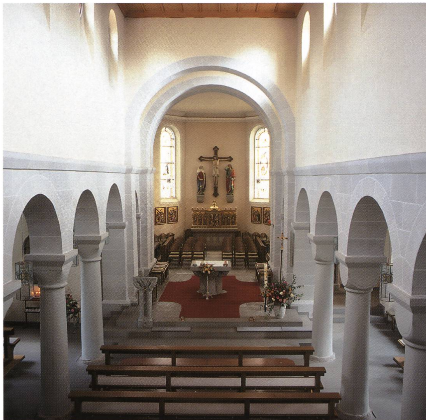
Abb. 9: Birndorf DE, Pfarrkirche Hl. Kreuz. Die flachgedeckte dreischiffige Säulenbasilika wurde wohl im ausgehenden 11. Jahrhundert errichtet. Kern der Anlage bilden zwei fünfjochige Arkaden, die sich durch unterschiedliche Kapitellformen auszeichnen.

Osten durch ein schwach ausgeprägtes Querschiff und eine kurze Vierung abgeschlossen werden, sind durch fünfjochige Arkaden unterteilt. Bei einer identischen Gestaltung der Bogen- und Säulenabfolge zeichnen sich die beiden Reihen durch unterschiedlich geformte Kapitelle aus. Für die elegant verschliffenen, älteren Kissenkapitelle der Südseite sind wenige Vergleichsbeispiele bekannt. Demgegenüber lehnen sich die Würfelkapitelle der Nordseite eng an den von Hirsau aus verbreiteten Grundtypus an, der auch in der Klosterkirche Alpertsbach und im Münster zu Allerheiligen in Schaffhausen Verwendung gefunden hat. Unter dem Einfluss der burgundischen Abtei Cluny entwickelte sich das Schwarzwaldkloster Hirsau im deutschsprachigen Raum während des 11. und 12. Jahrhunderts zu einem bedeutenden Zentrum der monastischen und kirchlichen Reformbewegung. Die mehr als hundert Niederlassungen umfassende Kongregation orientierte sich zunächst am burgundischen Vorbild, entwickelte dann aber eine eigene schlichte Architektur- und Formensprache, die