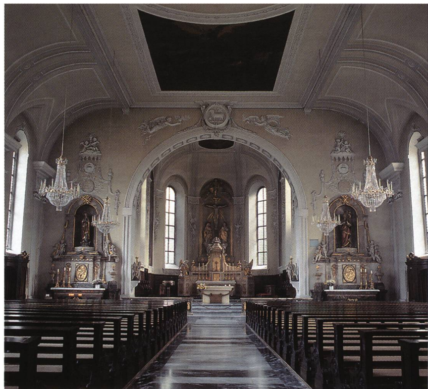
Abb. 31: Waldshut-Tiengen, Stadtteil Waldshut DE, Stadtpfarrkirche Liebfrauen und St. Johannes der Täufer. Die kühl und nüchtern wirkende Ausstattung des frühklassizistischen Raumes wurde unter Verwendung von Beständen aus dem 1806 aufgehobenen Benediktinerkloster St. Blasien vollendet.

Auch im öffentlichen Bereich wurde die Baukunst des Klassizismus rasch bestimmend. Die puritanisch-nüchterne Formensprache, die auf Zweckmässigkeit und Klarheit angelegt war, entwickelte sich in der Frühzeit des Kantons Aargau zur charakteristischen Staatsarchitektur. Sie spiegelte den politischen Neubeginn