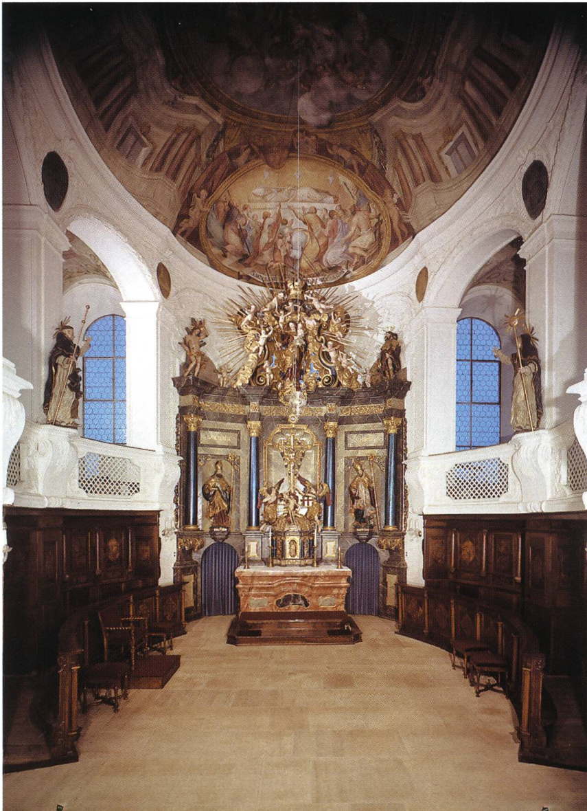
Abb. 24: Herznach CH, Pfarrkirche St. Nikolaus. Verschiedene bestens ausgewiesene Fachkräfte, darunter auch der Tessiner Freskant Francesco Antonio Giorgioli und eine Gruppe italienischer Stuckateure, hatten an der glanzvollen Erneuerung des Herznacher Chorraumes mitgewirkt. Ihren Abschluss fanden die Arbeiten erst gegen 1732, als der Rheinfelder Bildhauer Johann Isaak Freitag den Hochaltar vollendete. Er bildet das Zentrum eines längsgerichteten Ovalchores, der sich zu beiden Seiten auf grossfenstrige Oratorien hin öffnet. (Bild: Denkmalpflege des Kantons Aargau, Aarau CH)

Bernbeuern bei Schongau stammende Säckinger Architekt auch die Pläne für die Anlage geliefert.