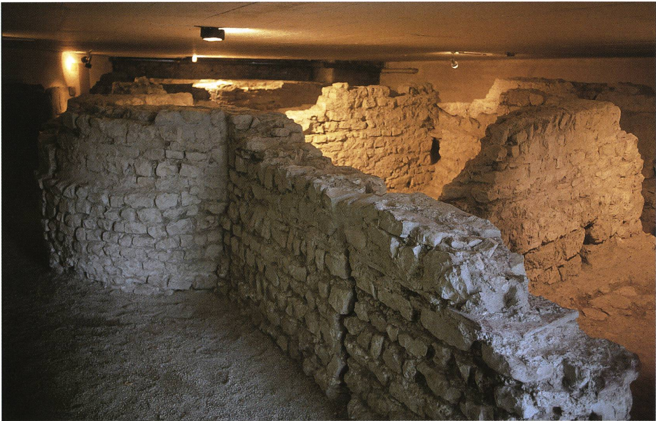
Abb. 1: Kaiseraugst CH, Kastellkirche. Auf dem Gelände nördlich der christkatholischen Pfarrkirche St. Gallus wurden 1960 die Fundamente eines christlichen Kirchenbezirks freigelegt, der auch als Bischofssitz diente.

Insbesondere in der führenden Gesellschaftsschicht blieben die überlieferten Ideale und