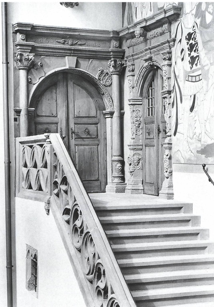
Abb. 16: Rheinfelden CH, Rathaus. Als Abschluss der grossen Freitreppe im Rheinfelder Rathaushof schuf Johann Ammann zwischen 1612 und 1614 zwei Renaissanceportale, in deren Formensprache bereits der frühe Barock anklingt.

Bauten im ländlichen Raum jedoch eher Ausnahmen. Vielmehr handelt es sich häufig um verhältnismässig niedrige, gedrungene Türme, die meist im Westen an das Kirchenschiff, seltener seitlich an den Chor anschliessen.