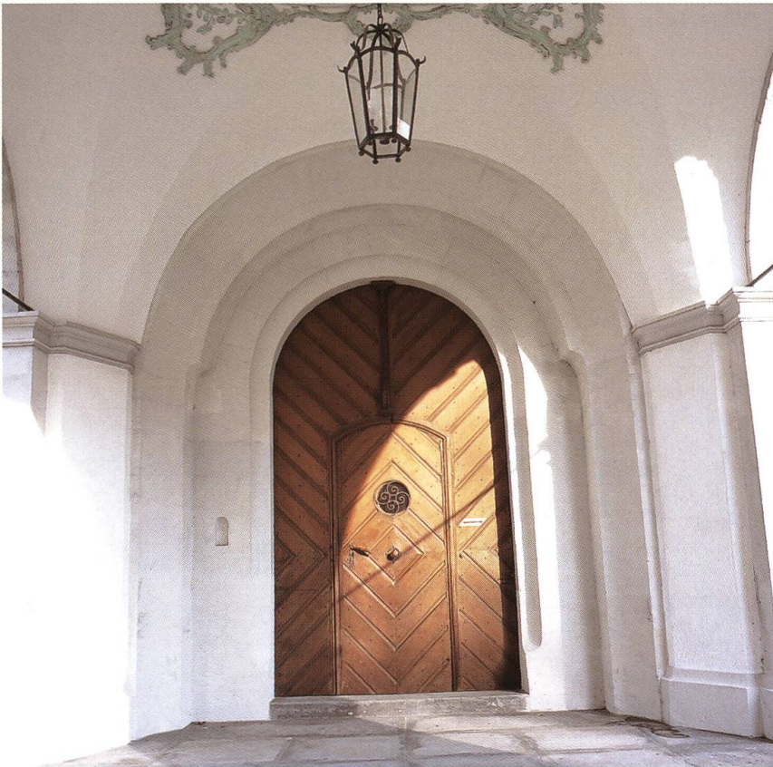
Abb. 8: Rheinfelden CH, Stadtkirche St. Martin. Das romanische Westportal entstand wohl im Zusammenhang mit dem Bau einer dreischiffigen Basilika im 12. Jahrhundert. Im Rahmen der barocken Umgestaltung des Langhauses wurde das Gewände um 1770 stark überarbeitet.

11. und dem mittleren 12. Jahrhundert tiefgreifende Umgestaltungen. Das Langhaus, an das sich ein eingezogener, quadratischer oder apsidialer Altarbezirk anschloss, wurde meist über mehrere Stufen zur dreischiffigen Basilika erweitert. Diese Entwicklung lässt sich an der Rheinfelder Martinskirche modellhaft nachzeichnen. Zwischen dem späten 11. und dem mittleren 12. Jahrhundert wurden der frühromanischen Saalkirche im Süden, Norden und Westen seitenschiffartige Kapellentakte angeschlossen. Den schlecht proportionierten Bau ersetzte dann wohl noch im 12. Jahrhundert eine dreischiffige Basilika, die verschiedene Elemente der Vorgängeranlage in sich aufnahm. 18