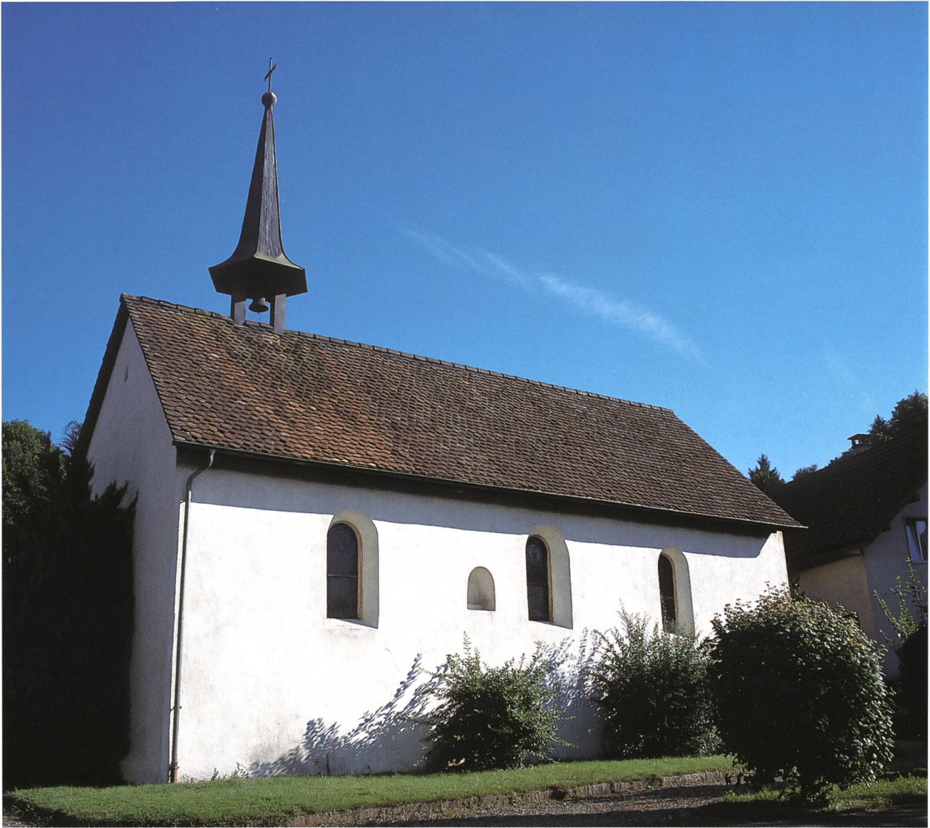
Abb. 7: Rheinsulz CH, Kapelle St. Margaretha. Der Kleinbau, der teilweise ins 11. Jahrhundert zurückreicht, zeigt eine für zahlreiche Kirchen und Kapellen des Früh- und Hochmittelalters charakteristische Grundform. An den kleinen, rechteckigen Versammlungsraum schliesst übergangslos der Chorbereich an. Beide Raumelemente liegen unter einem durchgehenden, von einem Dachreiter bekrönten Satteldach. (Bild: Erich Treier, Oberhof CH)

sen oder als sichtbare Zeugnisse einer Vorgängeranlage an anderer Stelle weiterverwendet. An der nördlichen Aussenwand der Kapelle St. Ursula in Münchwilen befindet sich eine reich verzierte Nische aus gelblichem Kalkstein. Die Kerbschnitt- und Rankenmotive lassen sich mit Mustern aus dem elsässischen und badischen Raum vergleichen, die in der zweiten Hälfte des 11. und zu Beginn des 12. Jahrhunderts entstanden sind. Ob es sich ursprünglich um eine Fenster- oder um eine Figurennische handelte, bleibt ebenso ungewiss