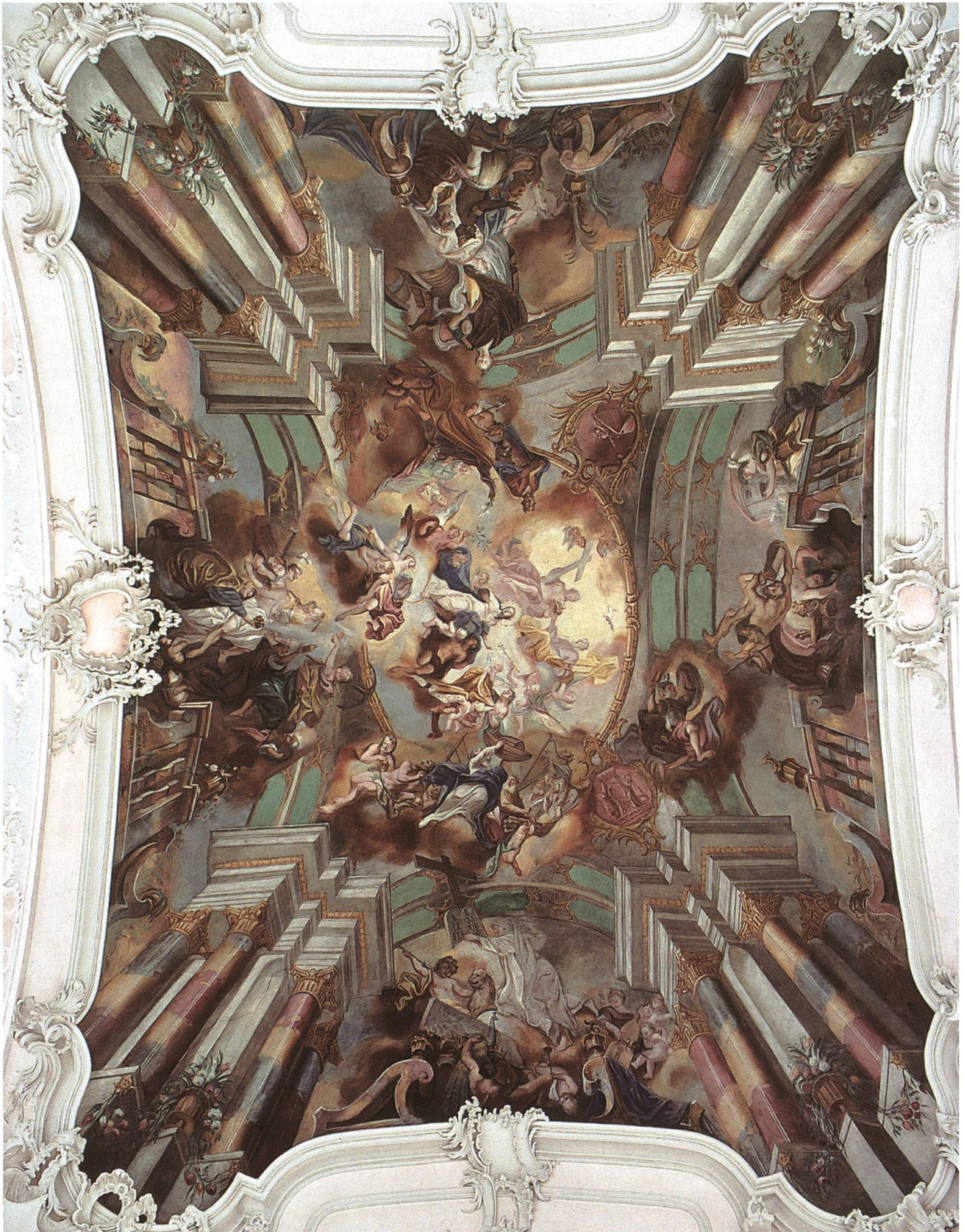
Abb. 27: Waldshut-Tiengen, Stadtteil Tiengen DE, Stadtpfarrkirche Maria Himmelfahrt, zentrales Deckengemälde. Nach dem Raumschema der vorarlbergischen Wandpfeilerkirchen errichtete Peter Thumb 1753/54 in Tiengen einen grosszügigen sakralen Festsaal. Die Darstellungen, die der Freskant Eustachius Gabriel in die weit gespannten Kuppeljoche des Langhauses einfügte, öffnen den architektonischen Rahmen auf imaginäre Räume hin.