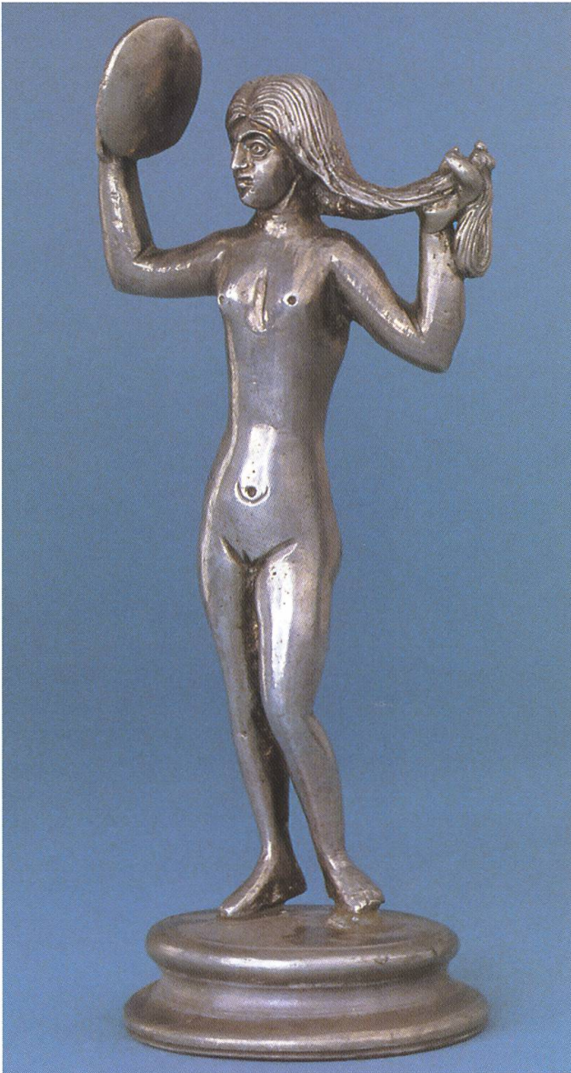
Abb. 2: Kaiseraugst CH, Statuette der römischen Liebesgöttin Venus. Die aus massivem Silber gearbeitete Figur bildet Teil des Silberschatzes, der um die Mitte des 4. Jahrhunderts im Kastell Kaiseraugst verborgen und 1961/62 wiederentdeckt wurde.

rast zur Alltagssituation im zeitweise hart umkämpften Castrum zu stehen scheint, eröffnet einen Einblick in eine fürstlich gehobene mediterrane Stadtkultur. Bei festlichen Mahlzeiten pflegte die römische Aristokratie Statuetten von Göttern und Helden als Schmuck und zur Weihe des reich gedeckten Tisches aufzustellen. Aus diesem Brauch erklärt sich die Tatsache, weshalb die elegante Figur der Venus, die wohl im 4. Jahrhundert in einer gallischen Werkstatt entstand, Teil des Tafelsilbers bildete (Abb. 2).