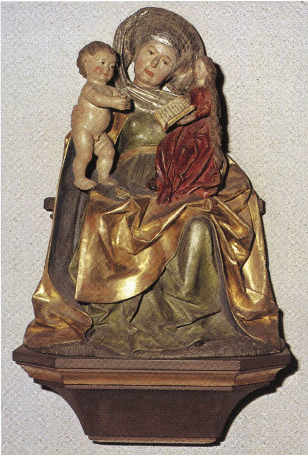
Abb. 13: Gipf-Oberfrick CH, Pfarrkirche St. Wendelin. Die farbig gefasste Skulptur der heiligen Anna selbdritt entstand um 1480. Von innerer Ruhe getragen, spiegelt die im Spätmittelalter beliebte Darstellung die drei Lebensalter wider.

mystischem Gedankengut und den verbreiteten Passionsspielen beeinflusst, strebten die Künstler möglichst lebensnahe Darstellungen an, die gelegentlich in einen übersteigerten Realismus mündeten. Der monumentale spätgotische Kruzifixus in der Pfarrkirche St. Martin in Wittnau lässt diese Gesinnung ebenso erahnen, wie die in einigen Pfarreien erhaltenen Vesperbilder.