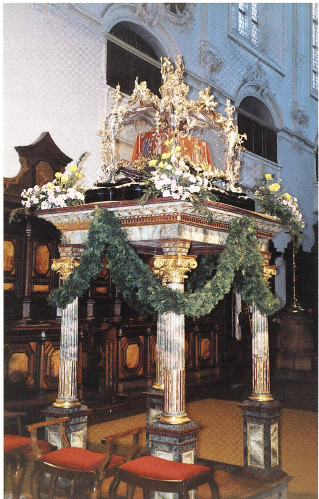
Abb. 30: Bad Säcking DE, St.-Fridolins-Münster. Der Fridolinsschrein legt ein eindruckliches Zeugnis für die hohe Kunstfertigkeit ab, über die Augsburger Gold- und Silberschmiede im 18. Jahrhundert verfügten. Der in einer Seitenkapelle des Münsters verwahrte Schrein wird am Fridolinsfest im Chor aufgestellt und in der Prozession mitgetragen.

Bis ins späte 18. Jahrhundert blieb die Grenze zwischen den Tätigkeitsbereichen des Handwerkers und des bildenden Künstlers fließend. Fachliches Können und individuelle Innovationskraft bildeten eine untrennbare Einheit. Für diese Verbindung legt das reich gestaltete