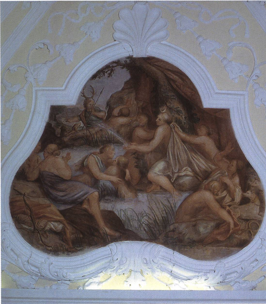
Abb. 22: Bad Säckingen DE, Gartenpavillon im Park des Schlosses Schönau. Im Rahmen der Neugestaltung der Gartenanlage entstand auf der aussichtsreichen Terrasse unmittelbar über dem Rhein um 1720 ein «Teehäuschen». Im Deckengewölbe des über quadratischem Grundriss errichteten Gebäudes schuf der Tessiner Freskant Francesco Antonio Giorgioli einen Gemäldezyklus, der inhaltlich Themen aus der antiken Mythologie aufgreift.

bilden, erscheinen in der Kuppel des Teehauses am Rhein Szenen aus der antiken Mythologie (Abb. 22).