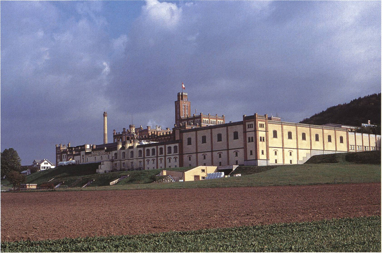
Abb. 32: Rheinfelden CH, Brauerei Feldschlösschen. Der wirtschaftliche Aufschwung, den Rheinfelden nach der Eröffnung der Eisenbahnlinie Basel–Brugg im Jahre 1875 erlebte, hat im Bau mehrerer Fabrikanlagen einen sichtbaren Ausdruck gefunden. Zu den eindrucklichsten Industriekomplexen zählt die Brauerei Feldschlösschen, die bis in die Mitte des 20. Jahrhunderts kontinuierlich erweitert wurde. Seit 1882 prägen Elemente einer stilisierten Wehrarchitektur das charakteristische Erscheinungsbild der vielgliedrigen Gebäudegruppe.