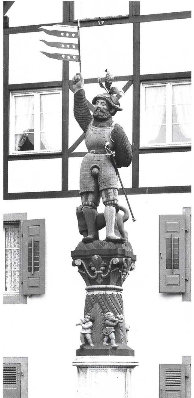
Abb. 18: Rheinfelden CH, Albrechtsbrunnen.

Die vorzüglichen Kabinettscheiben im Rheinfelder Rathaus gehen auf Stiftungen der österreichischen Landesherren, des einheimischen Adels und der befreundeten Waldstädte zurück. Die 1532/33 und 1581 entstandenen Werke, in denen zahlreiche Motive aus Scheibenrissen Hans Holbeins des Jüngeren auf-