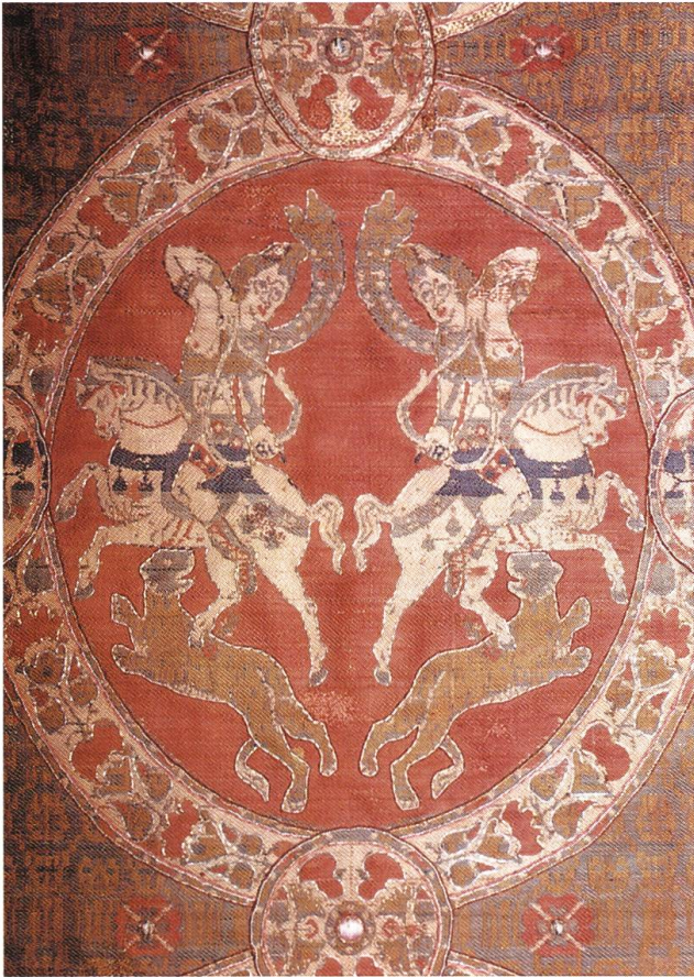
Abb. 4: Bad Säckingen DE, St.-Fridolins-Münster, Ausschnitt aus dem «Amazonenstoff». Das kostbare Seidengewebe diente als Hülle für die Reliquien des Kirchenpatrons und wurde um die Mitte des 19. Jahrhunderts zu einem Messgewand mit Stola und Manipel umgearbeitet.

Winkelgangkrypta erhalten. 7 Die Anlage besteht aus zwei rechtwinklig gebrochenen Gangsystemen, die in der Mittelachse des Kirchenbaus auf einen tonnengewölbten Zentralraum treffen. Dieser öffnet sich nach Westen auf eine rechteckige Gruft, die als Bestattungs- und Verehrungsort des heiligen Fridolin diente, nach Osten in einen apsidialen, durch ein Mittelfenster erhellten Altarbereich. Der Hauptraum der Krypta lässt sich mit der Anlage im Zürcher Fraumünster vergleichen, das bereits im 9. Jahrhundert in enger personaler Beziehung zum Inselkloster am Hochrhein stand. 8 Die Kernsubstanz des in der Folge mehrfach veränderten Gangsystems dürfte im 10. Jahrhundert entstanden sein. In diesen grundlegenden Bauabschnitt wurden kleinere Mauerfragmente älterer Zeitstellung einbezogen, die wohl Teil einer älteren Klosteranlage bildeten (Abb. 3). 9