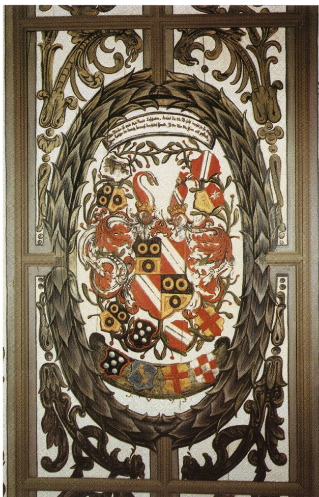
Abb. 21: Oeschgen CH, Schlösschen. Otto Rudolf von Schönau (1670–1699) liess seinen herrschaftlichen Landsitz mit einer reich bemalten Felderdecke ausstatten. Sie konnte im Zusammenhang mit den Sanierungs- und Wiederherstellungsarbeiten von 1973/74 vom Historischen Museum Basel zurück-erworben und wieder eingebaut werden.

◊ Abb. 20: Laufenburg CH, Marktgasse. Im Vergleich zu den Munizipalstädten der benachbarten Eidgenossenschaft herrschte in den vorderösterreichischen Waldstädten am Hochrhein eine weithin schlichte Baukultur vor. Die militärischen Auseinandersetzungen des 17. und frühen 18. Jahrhunderts liessen hier kaum Spielraum für die aufblühende barocke Dekorationskunst, die wenigen Akzentbauten vorbehalten blieb.