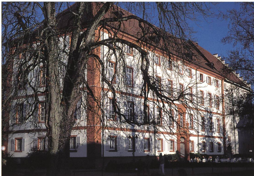
Abb. 26: Beuggen DE, Haupttrakt der ehemaligen Deutschordens-Kommende. Zu den Projekten, die Johann Kaspar Bagnato zwischen 1752 und 1757 in Beuggen verwirklichte, zählt auch das «neue Schloss», das er als repräsentative Barockresidenz mit prägnanter Portalzone konzipierte.

Gliederungsprinzipien der vorarlbergischen Wandpfeilerkirchen. Thumb setzte das bewährte Schema, den spezifischen Gegebenheiten folgend, in proportional ausgewogener Form um. Das weit ausgreifende Langhaus, das übergangslos in den Altarbezirk mündet, wird durch drei Joche mit querovalen Hängekuppeln gegliedert. Die zu beiden Seiten ausschwingenden Wandkapellen verstärken den Eindruck der Grosszügigkeit und akzentuieren die plastische Durchbildung der Raumschale. Die architektonische Konzeption verbindet sich mit einer qualitätvollen Dekorationskunst. Der erfahrene Wessobrunner Stuckateur Johann Georg Gigl und der junge, aus Bad Waldsee in Oberschwaben stammende Freskant Eustachius Gabriel ergänzten sich hier in kongenialer Weise. Im zentralen Deckenfresko, das die Himmelfahrt Mariä darstellt, wird die reale Wandgestaltung in einer hoch aufragenden Scheinarchitektur weitergeführt. In meisterhafter Perspektive öffnet sich der irdische Raum und gibt den Blick frei in die jenseitige, himmlische Sphäre. Lichtfülle, ausgreifende Weite und mit hoher Kunstfertigkeit inszenierte Malerei und Plastik bilden eine Summe barocken Raumgefühls (Abb. 27). 47