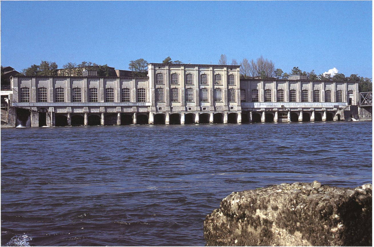
Abb. 33: Rheinfelden, Maschinenhaus des Kraftwerkes. Stauwehr, Werkbrücke und Maschinenhaus bilden ein die Flusslandschaft prägendes Ensemble aus den Anfängen der industriellen Elektrizitätserzeugung. Das älteste Laufkraftwerk Europas wurde zwischen 1894 und 1898 errichtet. Im lang gestreckten Maschinenhaus, das auf nüchterne Funktionalität angelegt ist, lebt noch die Architektursprache des späten Klassizismus nach.

Hier wurden bei der Errichtung des neuen Hochaltars auch Teile eines spätgotischen Altars wiederverwendet.