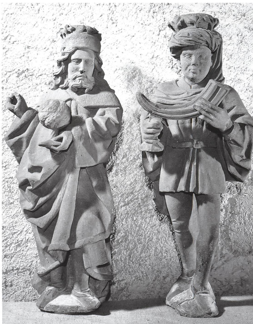
Abb. 10: Rheinfelden CH, Stadtkirche St. Martin. Eine Werkgruppe, die möglicherweise mit der Basler Münsterbauhütte in Beziehung stand, arbeitete im dritten Viertel des 15. Jahrhunderts für die Rheinfelder Pfarr- und Stiftskirche. Die zwei Könige, die ursprünglich Teil einer Anbetungsgruppe bildeten, gehören zu den wenigen Beispielen gotischer Bauplastik, die sich im Raum der vier Waldstädte am Hochrhein noch erhalten haben.

frankreich entstandene neue Architekturauffassung beim Bau des Strassburger Münsters durchgesetzt. Zur Verbreitung des gotischen Stils trugen die Bettelorden wesentlich bei. Ihre Kirchenbauten, die sich beispielsweise in der Barfüsserkirche in Basel oder der Klosterkirche Königsfelden erhalten haben, wurden einerseits durch die Ordenssatzungen, andererseits durch die Bedürfnisse der Volksseelsorge geprägt. In der reifen Form des 14. Jahrhunderts lebt der Typus der dreischiffigen Basilika mit lang gestrecktem Chorraum im Säckinger Münster, aber auch in den Stadtkirchen von Rheinfelden und Laufenburg fort.