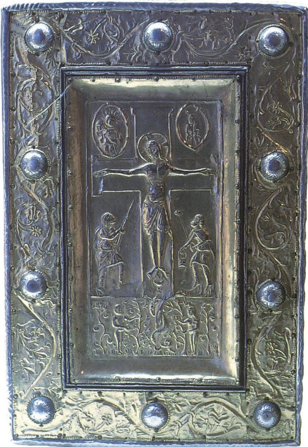
Abb. 6: Bad Säckingen DE, St.-Fridolins-Münster, Buchkassette. Das in Goldblech getriebene, von einem breiten Rahmen gefasste Relief entstand in der zweiten Hälfte des 10. Jahrhunderts. Die Tradition, liturgische Bücher mit kunsthandwerklich reich gestalteten Hüllen einzufassen, stammte aus Irland und wurde auch in verschiedenen Klöstern auf dem Kontinent bis in die Gotik gepflegt.

lage blieb die Grundstruktur des Vorgängerbaus in erweiterter Form erhalten. Zeitbedingte Strömungen und veränderte religiöse Bedürfnisse führten zum Anbau einer Vorhalle (Narthex) im Westen und später zur Erweiterung des Langhauses durch zwei Seitenkapellen. Damit wurde der ursprüngliche Grundriss zu einem lateinischen Kreuz variiert. 13