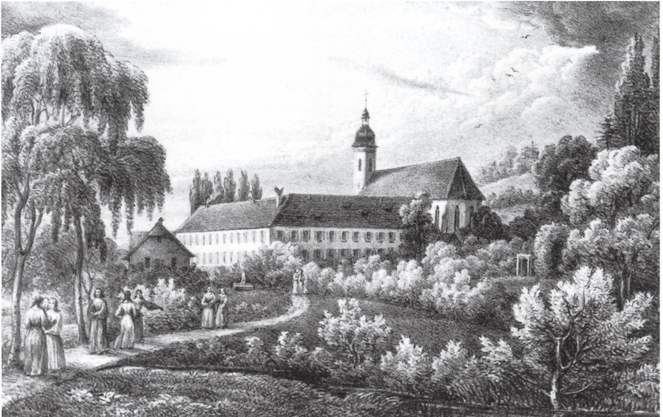
Abb. 16: Zwischen 1809 und 1835 wurde in den Räumen des aufgehobenen adeligen Damenstiftes Olsberg CH eine höhere Töchterschule eingerichtet. Die Institution, in der Mädchen beider Konfessionen den Unterricht besuchten, wirkte über die Grenzen des Kantons Aargau hinaus wegweisend.

gauische Regierung 1809 im aufgehobenen Stift Olsberg eine höhere Töchterschule. Das Institut, das Mädchen zu nützlichen Frauen erziehen sollte, erlangte vor allem aufgrund seines konfessionsübergreifenden Charakters eine überregionale und wegweisende Bedeutung. Die Schule wurde jedoch 1835 ersatzlos aufgehoben. Damit blieb eine über die Elementarbildung hinausreichende Unterweisung von Mädchen und jungen Frauen wieder weitgehend privater Initiative überlassen (Abb. 16). 47 Staatliche Förderung erfuhren die Fächer, die den Schülerinnen die Fertigkeit und möglichste Selbstständigkeit [...] in den weiblichen Handarbeiten vermittelten und sie auf ihre künftige gesellschaftliche Rolle als Hausfrauen und Mütter vorbereiteten. 48