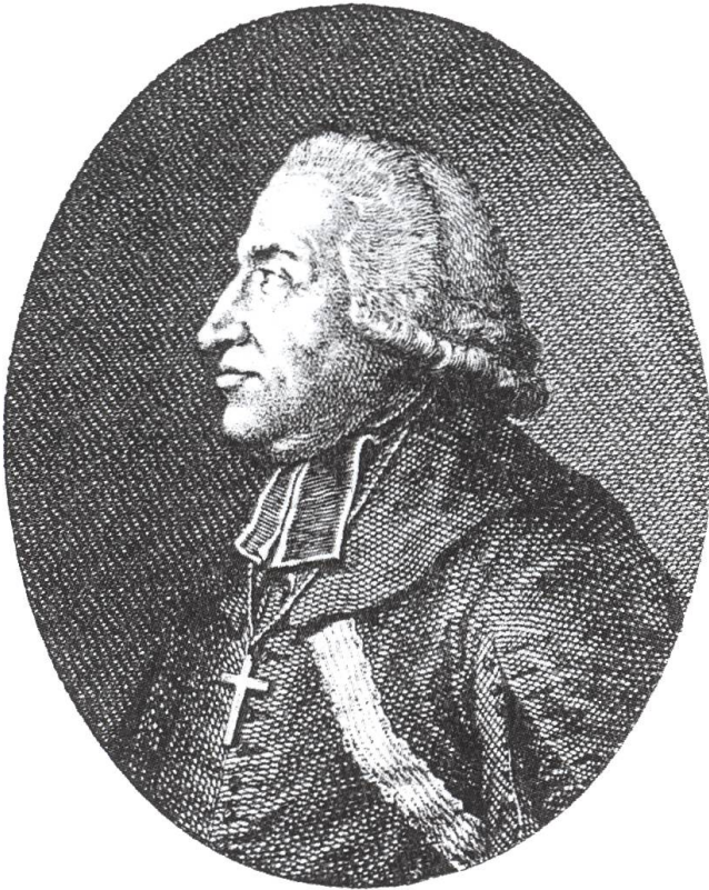
Abb. 5: Johann Ignaz von Felbiger (1724–1788) leitete im Auftrag Kaiserin Maria Theresias (1717–1780) in den deutschsprachigen Gebieten der habsburgischen Erbländer eine grundlegende Schulreform ein. Seine methodischen Ansätze strahlten über die Zisterzienserabtei St. Urban auch auf katholische Gebiete der Eidgenossenschaft aus.