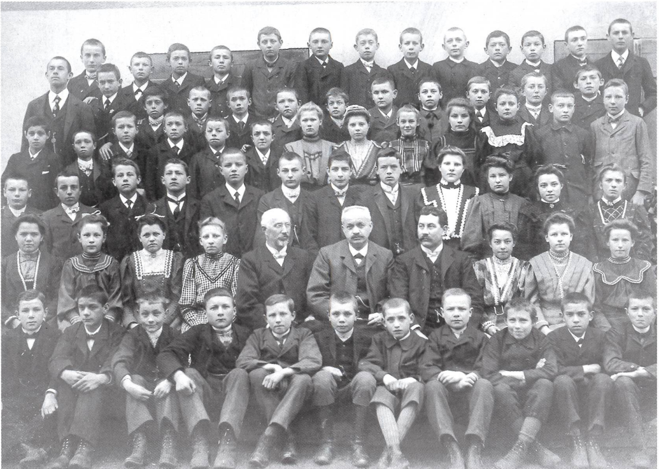
Abb. 14: Schüler und Lehrer der Bezirksschule Frick um 1909. Trotz der oft bescheidenen materiellen Ausstattung der Anfangszeit entfalteten sich die Bezirksschulen bis zu Beginn des 20. Jahrhunderts zu einem unverzichtbaren Bestandteil des regionalen Ausbildungsangebotes.

des 19. Jahrhunderts die Grundlage für die Gründung neuer Bezirksschulen. In Randregionen wie dem Fricktal, die zunächst noch weitgehend agrarischen Strukturen verhaftet blieben und nur sehr begrenzt in den Genuss eines wachsenden Wohlstandes kamen, leitete das Schulgesetz von 1865 eine Wende ein. Die höheren staatlichen Beiträge, die dieser Erlass vorsah, verhalfen dem Projekt einer Bezirksschule in Frick zum Durchbruch. Voraussetzung für den Bezug kantonaler Mittel bildete eine breite finanzielle Unterstützung auf regionaler Ebene. Die Standortgemeinde, die Dörfer im Einzugsgebiet der künftigen Schule sowie zahlreiche Privatpersonen fanden sich bereit, das Projekt zu unterstützen. Der Unterricht konnte im August 1866 im ehemaligen Schaffneigebäude der