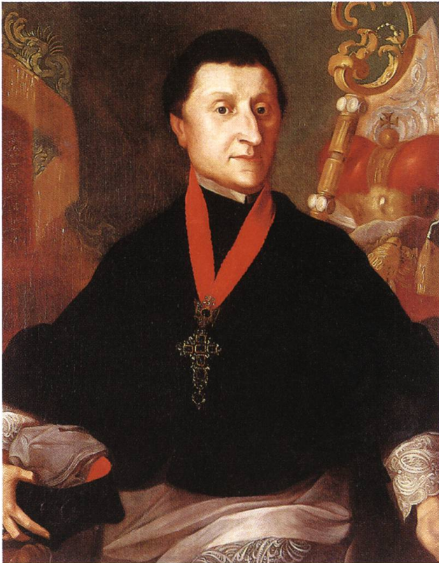
Abb. 3: Fürstabt Martin Gerbert (1720–1793) erliess für den sankt-blasianischen Zwing und Bann eine Schulordnung, die den Elementarunterricht regelte. Auf dieser Grundlage versuchte er den Ausbildungsstand der ländlichen Bevölkerung kontinuierlich zu verbessern. Der Prälat stand mit diesen Bemühungen in einer langen Tradition. Über Generationen hatte die Mönchsgemeinschaft des Schwarzwaldklosters dem Bildungswesen der Region entscheidende Impulse verliehen.

Massnahmen, welche die Monarchin im Bereich der niederen Schulen ergriff. Hier herrschten in der Regel wenig befriedigende Zustände.