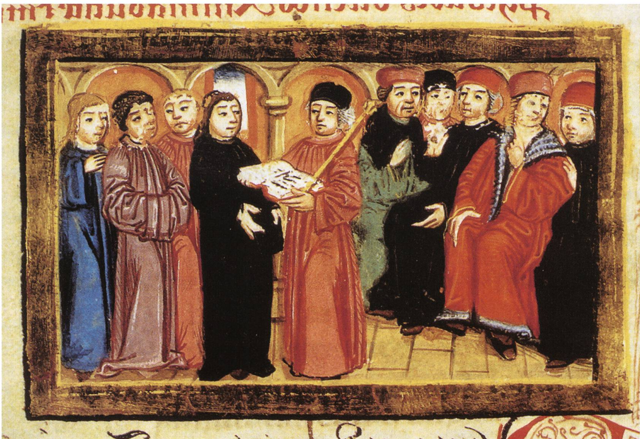
Abb. 2: Die 1457 durch Herzog Albrecht VI. von Habsburg-Österreich (1418–1463) gegründete Universität Freiburg im Breisgau besuchten auch zahlreiche Studenten aus dem Gebiet der vier Waldstädte am Hochrhein. Eine um 1500 entstandene Darstellung aus dem Statutenbuch des Collegium Sapientiae zeigt die Immatrikulation vor dem Rektor, der das Zepter und die Matrikel hält, sowie den Dekanen der vier Fakultäten und dem Partikularschulrektor.