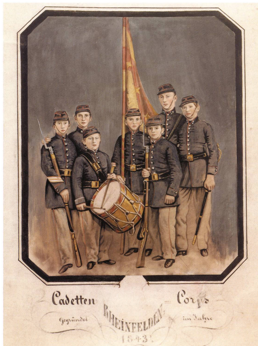
Abb. 15: Im Zusammenhang mit dem zweiten Jugendfest wurde im August 1843 in Rheinfelden ein Kadettenkorps gegründet. In Laufenburg und in Frick fanden die militärischen Übungen in der zweiten Hälfte des 19. Jahrhunderts ebenfalls einen festen Platz im Ausbildungsplan der Bezirksschulen. Nachdem die Uniformen und Chargen bereits vier Jahre zuvor abgeschafft worden waren, lösten die kantonalen Behörden die Kadettenverbände 1974 formell auf und führten den freiwilligen Schulsport ein.

suitenkollegiums, die einige Rheinfelder Bürger dem Rat 1716 vorlegten, waren nicht nur bildungs- sondern auch wirtschaftspolitisch motiviert. Die Stadt, so glaubten die Initianten, würde an Wohlhabenheit gewinnen, wenn sie eine grössere Zahl von Studenten beherbergen könnte. Zahlreiche Einwände aus der Bevölkerung und die unzureichenden finanziellen Mittel liessen das Projekt in der Fol-