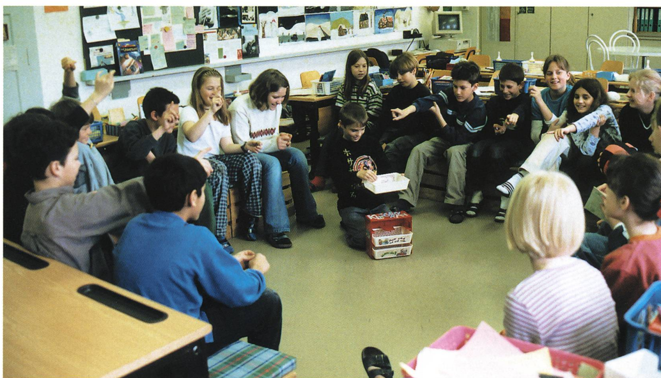
Abb. 20: Schülerinnen und Schüler der Primarschule Möhlin. Im Klassenrat finden sie ein Forum, um anstehende Fragen zu klären und Konflikte im Gespräch zu lösen. Die tiefgreifenden Veränderungen der Lebensverhältnisse, die den Alltag zwischen Jura und Schwarzwald in der jüngeren Vergangenheit kennzeichneten, haben auch im Schulunterricht einen unmittelbaren Niederschlag gefunden. Im Brennpunkt unterschiedlicher Interessen und gesellschaftspolitischer Entwicklungen bleibt die Ausbildung junger Menschen eine zentrale Aufgabe jeder Gemeinschaft.

geblieben, in dem sich pädagogische und soziale Anliegen mit wirtschafts- und gesellschaftspolitischen Interessen verbinden. Vor diesem Hintergrund haben die leitenden Prinzipien, die der Allgemeinen Schulordnung von 1774 zu Grunde lagen, ihre Aktualität nicht eingebüsst. Liess sich die Monarchin doch bei ihren Massnahmen von der Erkenntnis leiten, dass die Erziehung der Jugend beyderlei Geschlechtes als die wichtigste Grundlage der wahren Glückseligkeit der Nationen zu betrachten sei und deshalb besondere Aufmerksamkeit verdiene (Abb. 20). 63