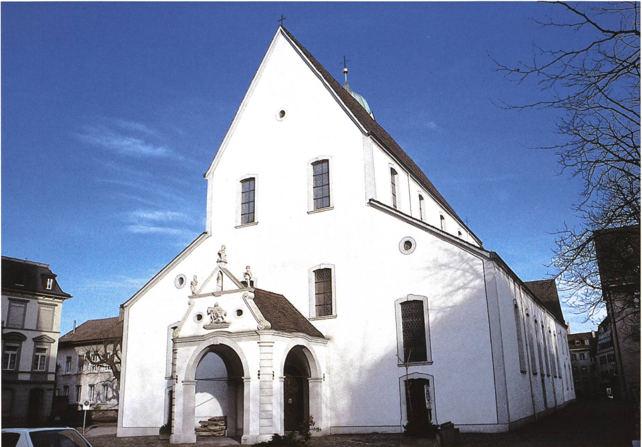
Abb. 1: Neben der Seelsorge betreuten die Chorherren des Stiftes St. Martin in Rheinfelden CH auch eine Lateinschule. Sie vermittelte elementare Kenntnisse und bereitete die Schüler auch auf den Besuch höherer Lehranstalten vor.

Nach der Vermittlung elementarer Kenntnisse sollten die höheren Stufen der Lateinschule auch den Zugang zu den Universitäten eröffnen. Im Laufe des 15. Jahrhunderts waren allein aus Rheinfelden neun Studenten in Heidelberg, fünf in Erfurt, zwei in Leipzig und einer in Wien immatrikuliert, wo sie zunächst den ersten akademischen Grad eines Baccalaureus erwarben. 5 Für das Gebiet zwischen Jura und Schwarzwald gewann die 1457 gegründete Universität von Freiburg i. Br. zunehmend an Bedeutung. Als der Lehrbetrieb aufgrund einer Pestepidemie eingestellt werden musste, zogen sich Professoren und Studenten 1501 teils nach Ehingen, teils nach Rheinfelden zurück, wo sie ihre Tätigkeit während einiger Monate fortsetzten (Abb. 2).