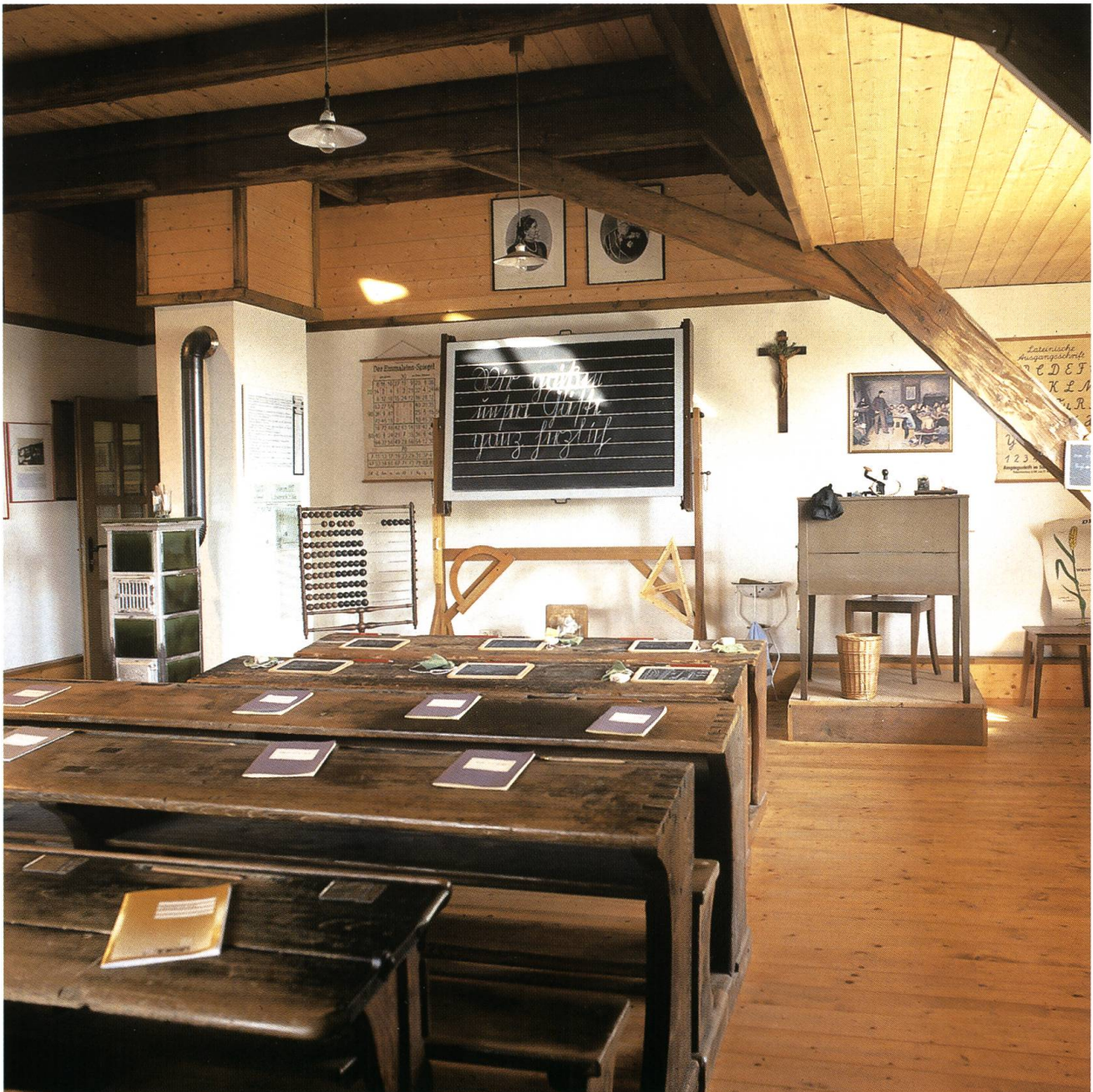
Abb. 11: Die Schulstube im Heimatmuseum Görwihl DE vermittelt einen Einblick in die Unterrichtsbedingungen um 1900. In kleineren Dörfern wurden die Lektionen für die Schüler aller acht Jahrgänge noch bis in die Mitte des 20. Jahrhunderts von einem Lehrer erteilt.

In den teilweise heftigen Auseinandersetzungen, die auf verschiedenen Ebenen ausgetragen wurden, setzten sich die liberalen Kräfte durch. Damit wandelten sich auch die Akzente der Ausbildung. Die sittliche und religiöse Erziehung behielt zwar einen hohen Stellenwert, stand aber nicht mehr im Zentrum des Fächer- und Prüfungsplanes. 28 Im April 1869 erliessen die Behörden in Karlsruhe einen umfassenden