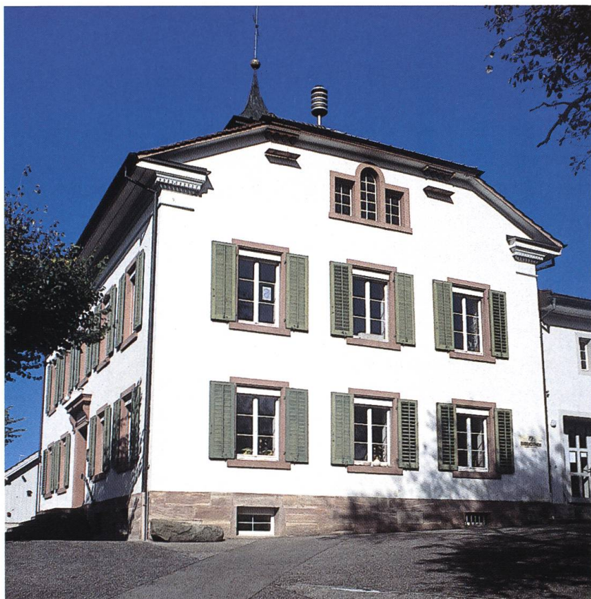
Abb. 12: Schulhaus in Olsberg CH. Während des 19. Jahrhunderts errichteten die Gemeinden auf Zweckmässigkeit angelegte, zwei- bis dreistöckige Schulhausbauten. Sie brachten kommunales Selbstbewusstsein zum Ausdruck und vereinigten meist verschiedene Raumbedürfnisse unter einem Dach.

Obschon das Schulgesetz von 1835 ein hinreichendes Angebot dieser dezentralen Ausbil-