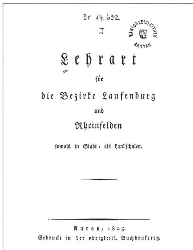
Abb. 10: Das Schulsystem aus der Zeit der Monarchie wurde im Fricktal zunächst mit kleinen Anpassungen weitergeführt. Die Instruktion für den Elementarunterricht, die unter dem Titel Lehrart für die Bezirke Laufenburg und Rheinfelden sowohl in Stadt- als Landschulen im Mai 1805 erschien, stützte sich weitgehend auf die Allgemeine Schulordnung von 1774.