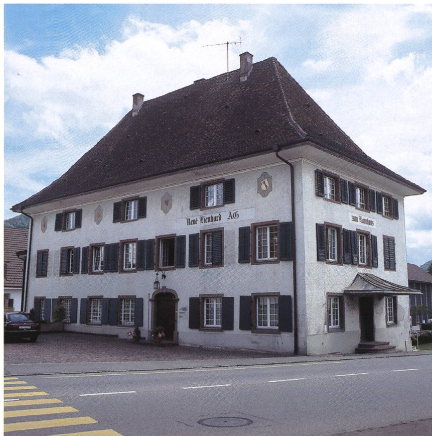
Abb. 13: Nach Rheinfeldern und Laufenburg wurde im August 1866 auch in Frick CH eine Bezirksschule eröffnet. Im ehemaligen Schaffneigebäude der Deutschordenskommende Beuggen unterrichteten zunächst zwei Haupt- und ein Hilfslehrer 48 Schüler, die im Markt Flecken und in den umliegenden Gemeinden wohnten.

Stabile politische Verhältnisse sowie die rasche Entwicklung von Wirtschaft und Technik, die zu einer steigenden Wertschätzung höherer Bildung beitrug, bildeten in der zweiten Hälfte