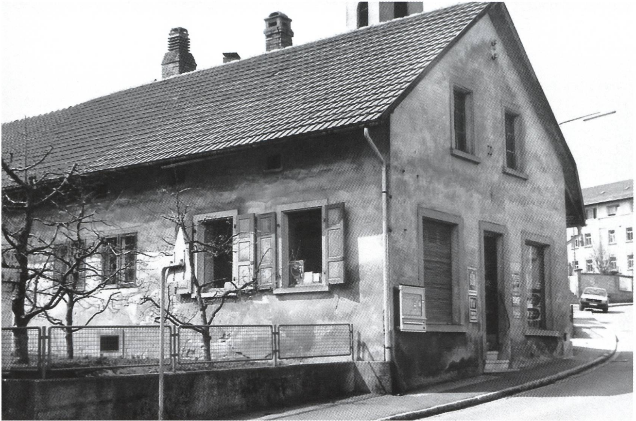
Abb. 8: 1786 stand in Murg das erste Schulhaus für den Unterricht bereit. Beim Bau wurde zum Teil Material verwendet, das ein Jahr zuvor beim Abbruch der St. Georgs-Kapelle im Ortsteil Helgeringen angefallen war. Neben einem Klassenzimmer fand im eingeschossigen Gebäude auch eine kleine Wohnung Platz. Die Aufnahme zeigt den Zustand der Liegenschaft im Jahre 1985.

Die Schule unter der Aufsicht des aargauischen und des badischen Staates – Bildung als Grundlage des bürgerlichen Selbstverständnisses