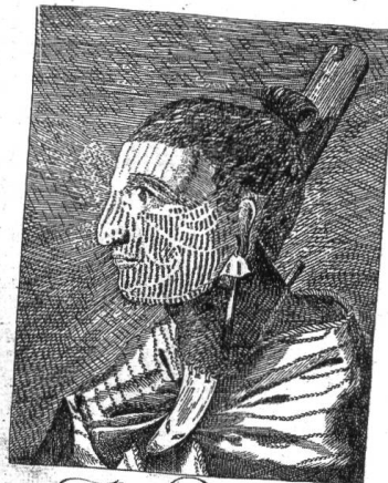
Neuseeländer Seite 27

Eine Fundgrube ist das handgeschriebene Direktorium von 1689 (M 22). Es gibt Auskünfte über Chor- und Pfarranniversarien, liefert detaillierte Beschreibungen aller liturgischen Verrichtungen unterm Jahr einschliesslich musikalischer Gestaltung besonderer Gottesdienste. Erwähnenswert ist auch das Jahrszeitbuch 1616 bis 1687. Neben der Auflistung aller Kaplaneipfründen, de-