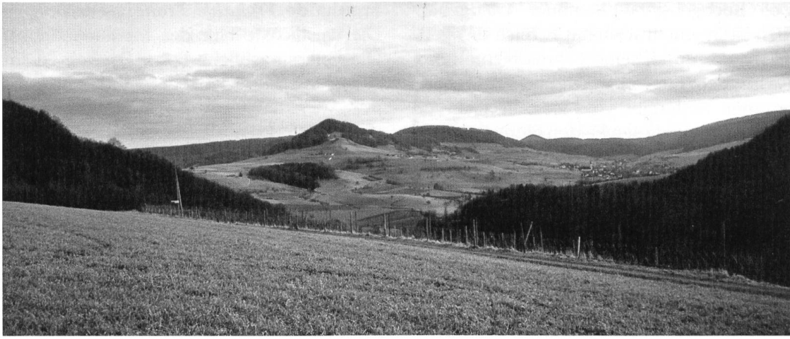
Abb. 3 Standort Herberig. (Von links nach rechts) Vordergrund: Stutz, Reben, Chilhalde, Meiershalde. Hintergrund: Geiss- berg, Laubberg, Gupf des Burerhörnli, Bütz- berg, Gansingen.

wandelt hat, einem Landmass, das mit einem Joch Ochsen in einem Tag zu pflügen war.