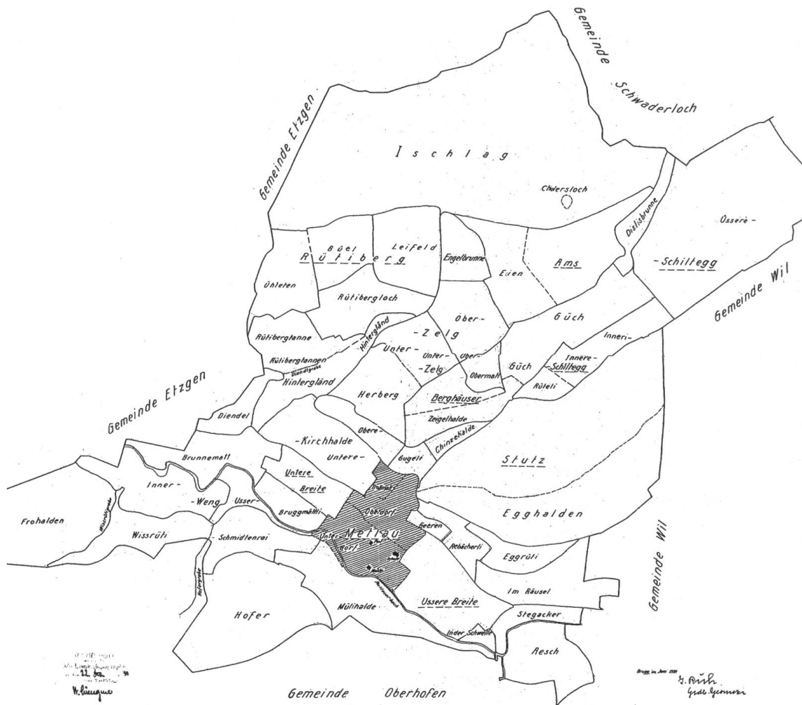
Abb. 2 Lage der Mettau- Fluren auf einem Plan von Geometer J. Ruh aus dem Jahr 1939. (Kant. Vermessungs- amt)

von 74 auf 50 zurückgegangen. Möglicherweise auch darum, weil in diesem Zeitraum bereits durch private Vereinbarungen Grundstücke zusammengelegt wurden. Die Entwicklung gewerblicher und industrieller Betriebe in der Region (Papierfabrik Albbruck, Sodafabrik Zurzach, Baldeschwiler Rheinsulz, Buser und Keiser Laufenburg) brachte nach und nach Arbeitsplätze als Ergänzung oder Ersatz zu den kleinbäuerlichen Betrieben.