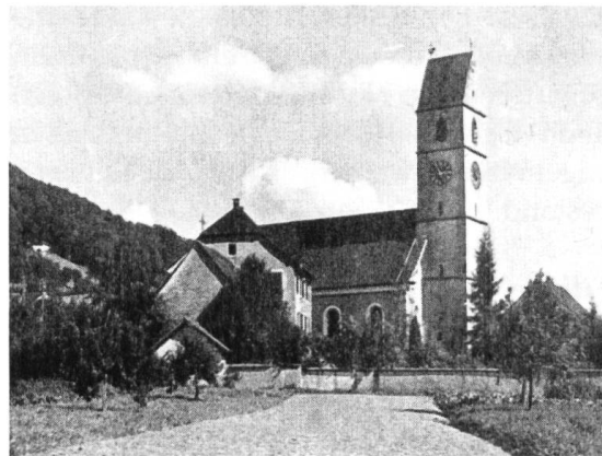
Abb. 4 Der ehemalige Pfarrhof mit Wohnteil und Öko- nomieanbauten.

Deutet auf den Besitz durch eine Grundherrschaft hin, auf das Kloster Säkingen. Der herrschaftliche ehemalige Pfarrhof mit