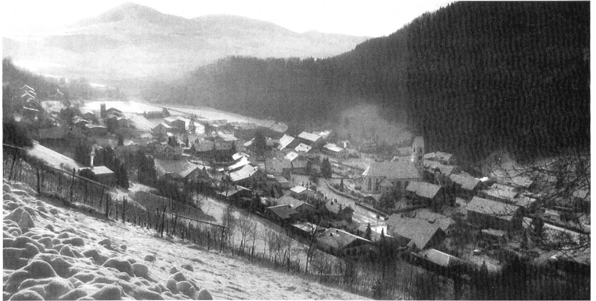
Abb. 1 Mettau. Links geht der Blick von Chilhalde, Oberdorf und obere Breiti zu Geissberg und Laubberg. Rechts die Kirche, dahinter die Mülihalde.

Die tiefsten Wurzeln meines Erinnerns gründen im zweiten Jahrzehnt des 20. Jahrhunderts. Seither haben sich die Lebensverhältnisse bedeutend verändert. Im landwirtschaftlichen Umfeld lässt sich das besonders augenfällig beobachten. In meinen ersten Schuljahren war fast bei jedem Haus ein Misthaufen, was manchem Stichwort ruft: Kleinbauerntum, Selbstversorgung, Parzellierung der Grundgüter. Meine Grosseltern mütterlicherseits hatten eine Kuh, gelegentlich ein Chälbli und eine Sau, und um diese Lebeware zu versorgen an sechs Orten Land: im Püntli, im Siggler, uf Güch, uf Rüteberg obe, i der Filbale . Und ich hatte als kleiner Helfer mitzutun: Gras vertue, cheere, schöchle, nooräche hinderem Heuwaage noo , so wie meine