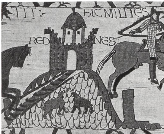
Abb. 4 Darstellung einer Motte auf dem Teppich von Bayeux (F) zwi- schen 1070 und 1082.

Wer die Wehranlage auf dem Herrain erbaute und wem sie als Wohnsitz diente, ist unsicher. Dass sie mit den Grafen von Homberg-Tierstein in Verbindung steht, ist hingegen wahrscheinlich. Seit dem 11. Jahrhundert besass die mächtige Hochadelsfamilie im damaligen Frickgau eine geschlossene Grundherrschaft. In Schupfart verfügte sie später über bedeutenden Besitz, darunter den Kirchenzehnten. 7 Eine Variante wäre daher, dass die Grafen die Wehranlage schon im 11. Jahrhundert erbauten und ihnen nebst den beiden Burgen Alt Homberg und Alt Tierstein als Wohnsitz diente. Eine andere Variante wäre, dass im Zeitraum des 10. bis 12. Jahrhundert ein aus der bäuerlichen Oberschicht aufgestiegener Grossgrundbesitzer aus Eigenantrieb die Befestigung errichtete – einerseits zur Abgrenzung seiner Stellung gegenüber der übrigen Dorfbevölkerung, andererseits zur Manifestierung seiner Besitzungen und Rechte. Dass es sich bei dieser Person um den legendären Hirminger gehandelt haben soll, der laut einer chronikalischen Überlieferung im Jahre 926 im Sisslerfeld die Ungaren überfallen und geschlagen hat, ist reine Spekulation. 8 Dieser Adelige, der dem Stand der so genannten