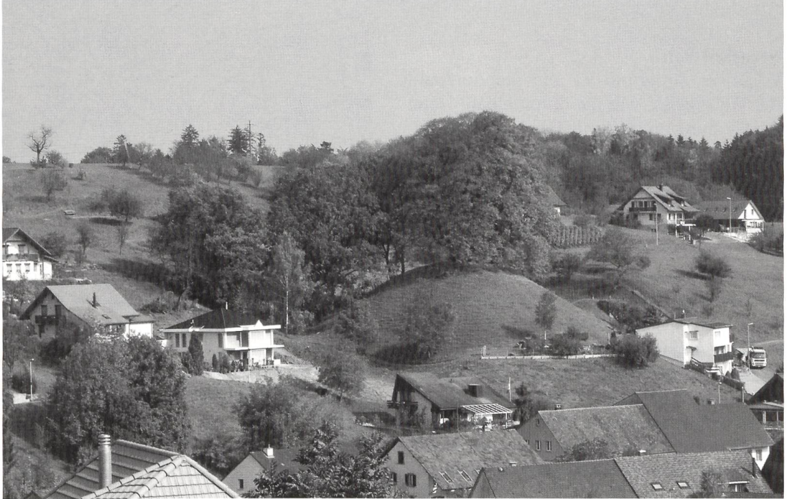
Abb. 1 Schupfart Herrain: Die Wehranlage von Südwesten.